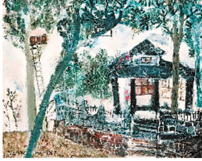
赵无极《我在杭州的家》。