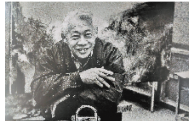
展厅中的赵无极照片。

这是一种血脉的传承。中国艺术史上这一代又一代人，他们的名字将时代串联，刻下独属于中国韵味的一笔一画。