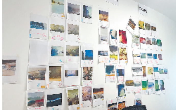
余旭红办公室墙上挂满了赵无极画作的打印件。