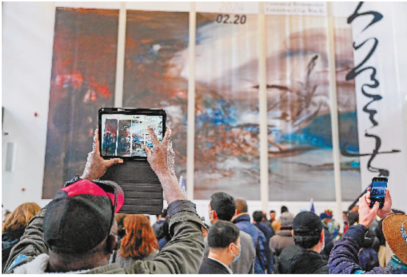
“赵无极百年回顾特展”现场。

正如他的名字，赵无极没有因循守旧，他自在地在艺术世界里，寻觅世界之道。这是大道无极的百年回音。