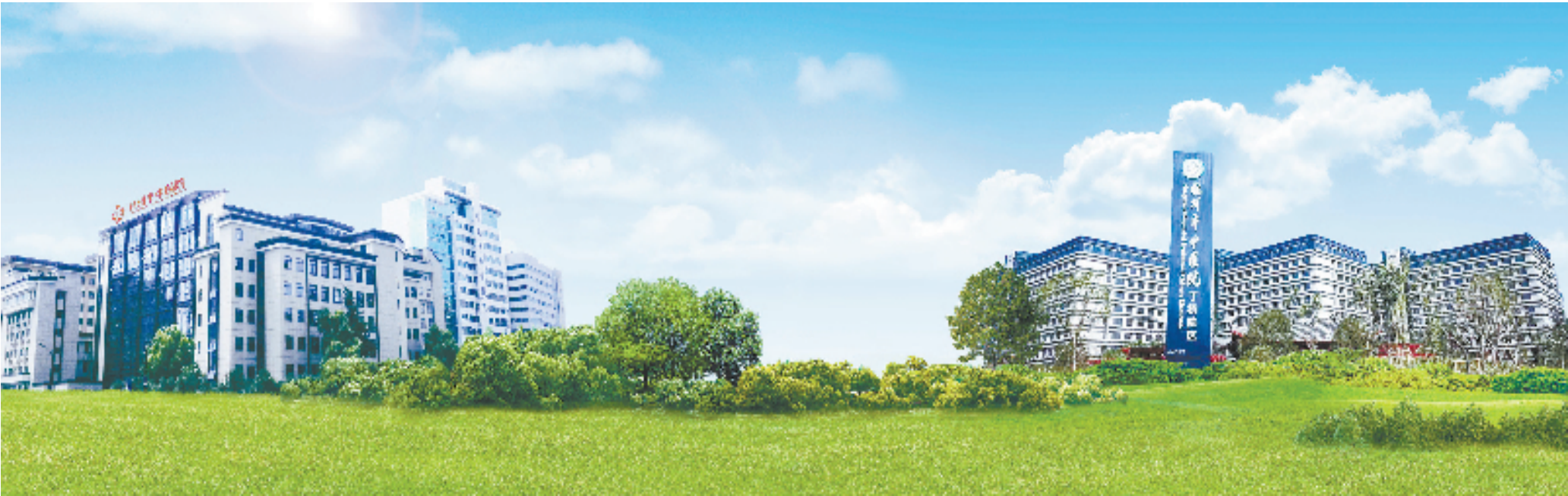
武林院区、丁桥院区两院区全景