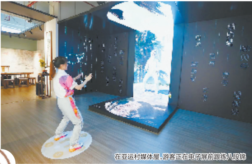
在亚运村媒体屋,游客正在电子屏前跟练八段锦

在迈向共同富裕的道路上,医疗健康服务扮演着举足轻重的角色。不断提升优质中医药服务的可及性与可得性,杭州市中医院正全力用“名医好药”赋能中国特色社会主义共同富裕先行和省域现代化先行“杭州范式”。 为了更好地服务广大病患,该院大力推动智慧医疗、智慧服务、智慧管理和智慧中医建设更承担国家中医药管理局“智慧中医医院建设推广研究项目”,包括“中医处方一件事”“放心云煎药”等12项建设内容,截至目前已完成11个项目并上线运行。开发5G智能远程治未病健康管理平台和中医优势病种辅助诊疗系统,该项目在今年3月被评为浙江省卫生信息学会数字健康“十佳案例”。 以技术骨干下沉山区海岛,助推城乡医疗协同发展。该院积极投入医疗卫生“山海”提升工程,与淳安县中医院、武义县中医院建立中医药特色专科“百科帮扶”合作,助推山区海岛中医药事业跨越式高质量发展,提升基层中医药服务能力,满足人民群众对中医药服务的需求。 为群众提供更优质、更便捷、更有效的中医药服务,杭州市中医院牵头成立浙江省中西医结合肾病专科联盟、浙江省中西医结合睡眠医学联盟与浙江省中医妇科专科联盟等。 此外,杭州市中医院积极落实东西部协作对口支援,指导和帮扶新疆阿克苏市人民医院和四川省德昌县中医院。近年来,选派多名高级职称医务人员前往新疆阿克苏市人民医院,开展门诊急、查房、教学、新技术、新项目等帮扶工作。 “融贯中西医,造福天下人”,未来,杭州市中医院将继续以人民为中心,满足广大群众对优质、特色中医药诊疗服务的需求,为开创“大杭州,高质量,共富裕”的发展新格局贡献中医药力量。