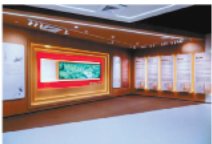
杭州市中医院院史馆、牌匾馆、中医药体验馆

成长路径的培养方式,着力提升中青年人才队伍质量。 持续的人才引育硕果累累。2022年,该院申报并立项全国名老中医药专家传承工作室5项,市级流派工作室1项,引进国医大师、全国名中医、岐黄学者、国家级中医药学会主委等数十位。2023年上半年,柔性引进特聘专家18人。新引进国医大师四位并设立工作室6个,新确立继承人17人。