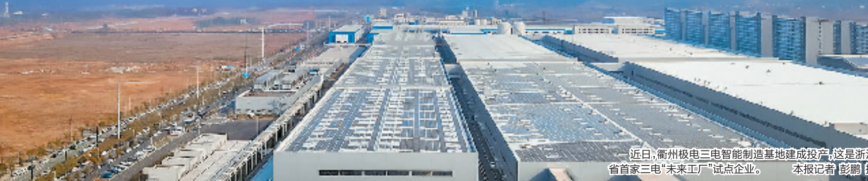
近日,衢州极电三电智能制造基地建成投产,这是浙江首家三电“未来工厂”试点企业。