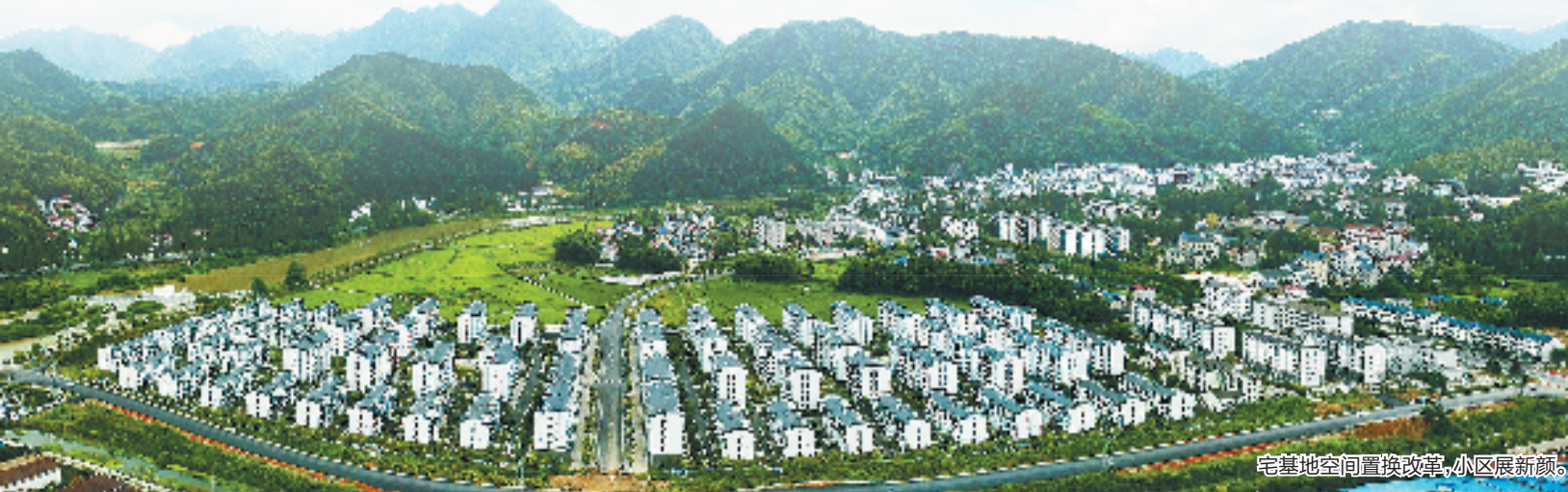
宅基地空间置换改革,小区展新颜。

开化县把“工分+排名”干部量化考核机制嵌入干部工作全链条,实现全面立体察人识人。推动干部队伍重塑,激活实干争先奔跑状态,通过六大“工分”多维度描绘干部“实力画像”,让躺平者“起身”、观望者“烫脚”、实干者“实惠”。推动选用导向重塑,掀起你追我赶奋进热潮,以“工分+排名”为支点,撬动形成“比实干赛实绩”“定排名争进位”的良好态势。截至目前,18名干部提拔重用,5名干部职级晋升,13名干部因排名末档暂缓晋升职级。