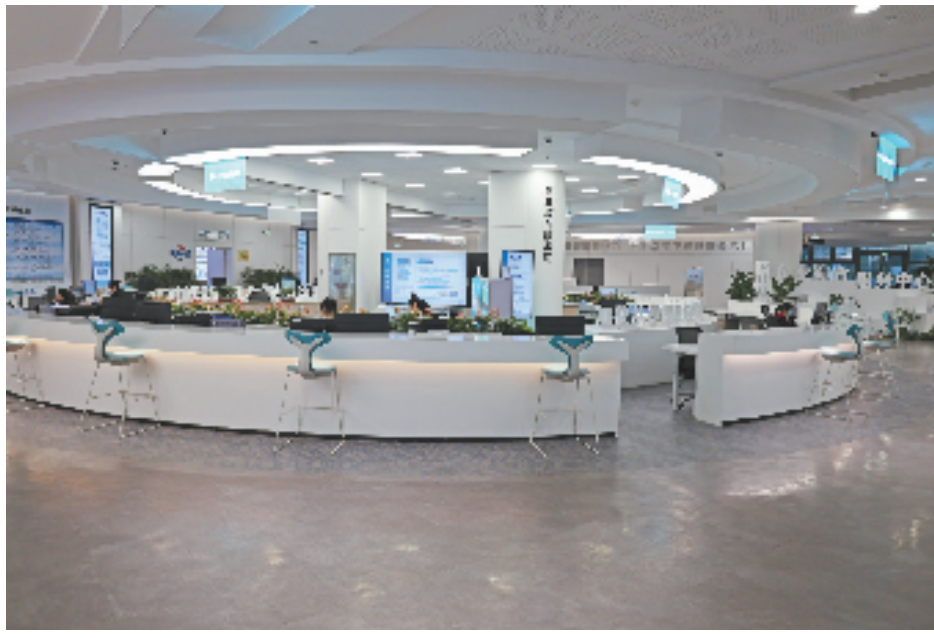
衢州企业综合服务中心

柯城区全方位构筑为企服务新阵地,形成以区级企业综合服务中心、助企法治驿站、助企网络为核心的“1+3+N”法治服务矩阵体系,在“家门口”为企业提供急需的涉法服务。全过程提升执法助企新质效,全面推行有礼执法、温情执法、智慧执法,执法检查同比减少40%,检查时间从5—7天降至3天内。全链条帮建助企安商新生态,聚焦助企服务全生命周期,积极开展法治体检、有礼调解、信用修复,办理涉企案件72件,帮助企业止损挽损近2亿元。