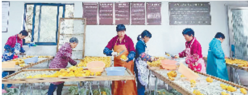
“之江同心·石榴红”富山乡共富工坊里在制作“番薯肚肚”