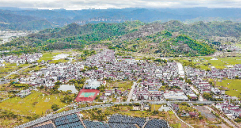
俯瞰天台县街头镇

如今的街头镇，非遗文化与乡村振兴相互促进，相得益彰。新乡贤充分发挥自己的优势和作用，以非遗为媒介，推动乡村产业升级、文化繁荣和生态宜居建设，美丽乡村画卷徐徐展开，一幅非遗与乡村振兴交相辉映的美好图景展现眼前。