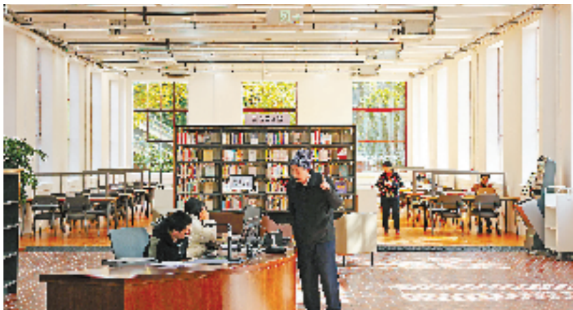
浙江图书馆大学路馆重新开放首日有不少读者前来“大饱眼福”。

本报杭州 12 月 5 日讯（通讯员 胡楠 记者 严粒粒）历经四年修缮, 浙江图书馆大学路馆 5 日正式面向公众重新开放。 浙江图书馆大学路馆位于杭州市上城区场宫弄, 于 1931 年 3 月竣工, 1932 年作为浙江图书馆总馆开放。2019 年, 浙江图书馆大学路馆作为“近现代重要史迹及代表性建筑”, 成为“全国重点文物保护单位”。 改造后的浙江图书馆大学路馆