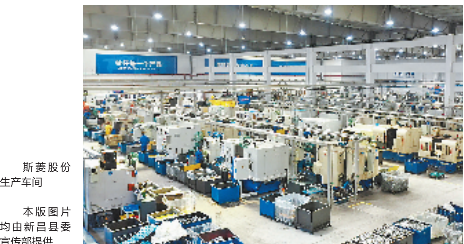
斯菱股份生产车间