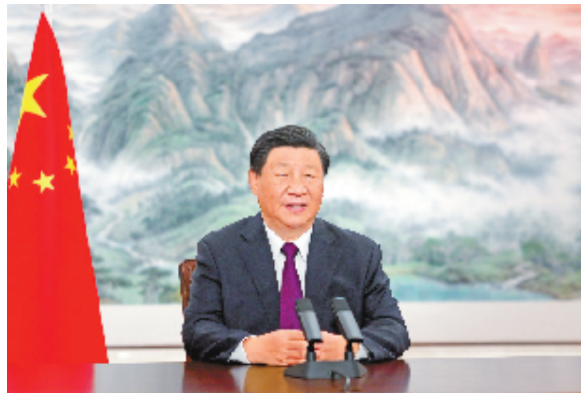
9月2日上午，国家主席习近平在北京向2023年中国国际服务贸易交易会全球服务贸易峰会发表视频致辞。

新华社北京9月2日电 9月2日上午，国家主席习近平在北京向2023年中国国际服务贸易交易会全球服务贸易峰会发表视频致辞。 习近平指出，当前，百年变局加速演进，世界经济复苏动力不足。服务贸易是国际贸易的重要组成部分，服务业是国际经贸合作的重要领域。全球服务贸易和服务业合作深入发展，数字化、智能化、绿色化进程不断加快，新技术、新业态、新模式层出不穷，为推动经济全球化、恢复全球经济活力、增强世界经济发展韧性注入了强大动力。 习近平强调，今年是中国改革开放45周年，中国将坚持推进高水平对外开放，以高质量发展全面推进中国式现代化，为各国开放合作提供新机遇。中国愿同各国各方一道，以服务开放推动包容发展，以服务合作促进联动融通，以服务创新培育发展动能，以服务共享创造美好未来，携手推动