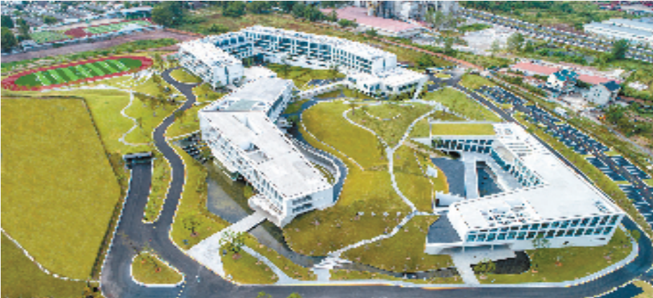
建德航空小镇产学研基地