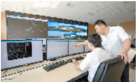
浙江省低空飞行服务中心

通航产业一直是建德市重点培育和发展的战略性新兴产业，“通过集聚各类要素资源，将建德航空产业打造成全省乃至全国通用航空产业的领军者和示范区”的目标也未曾改变。先发优势明显的建德，是否能抢抓低空经济发展机遇，释放新活力新潜力？我们拭目以待。