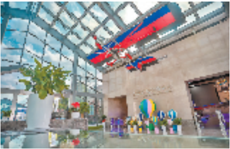
新联航空科普中心