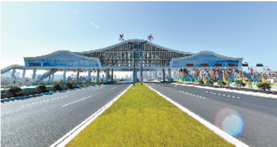
崭新大气的灵桥新互通

G25长深高速跨过富春江后,大气舒展的灵桥新互通映入眼帘,流畅的线条勾勒富春山水的肌理,偌大的“富”字在“富春山居图”的映衬下若隐若现。