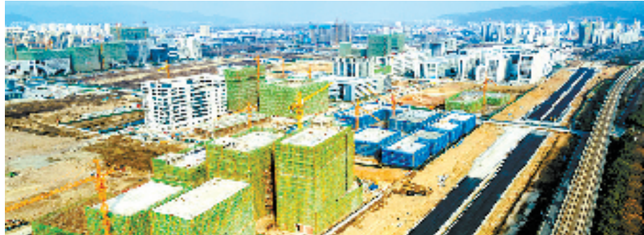
杭州富春湾新城建设热火朝天