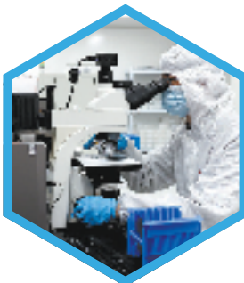
新城内聚集了不少高新企业。马赛洁 摄