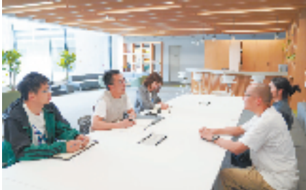
“钱小二”助企服务员上门走访服务企业

对内,钱开区“钱小二”亲企服务品牌也将提档升级,通过用好用足余杭区黄金68条等助企政策,持续推动数字化改造,组织实施机器人换人、企业上云等项目,加快培育“专精特新”、单项冠军等企业,激发民营经济新活力,为余杭争当建设共同富裕示范区的排头兵、为杭州“迎亚运”贡献产业力量。