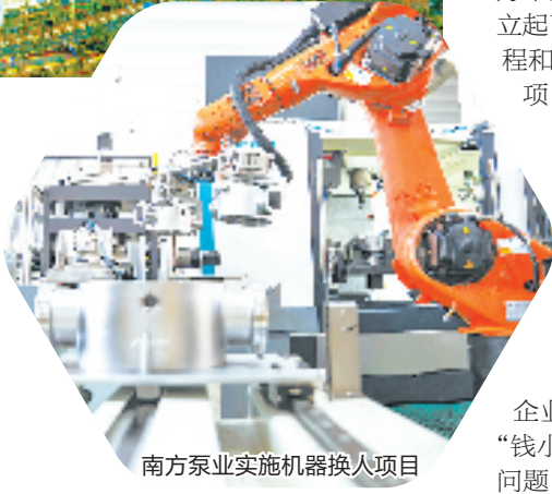
南方泵业实施机器人换人项目

“我们通过梯次培养,集聚腰部企业,让它们充满创新活力,形成发展动力,再进一步提高质效、做大做强。”钱开区管委会相关负责人说。目前,土星动力、高裕电子和威仕达机电已被列为余杭区上市企业培育对象。