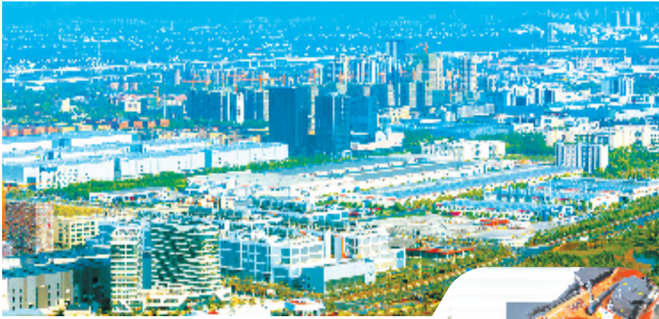
钱开区北部智能制造核心区

力的中小型科技企业、制造业企业、“小巨人”企业。它们因创新释放的产业潜力,超乎想象。