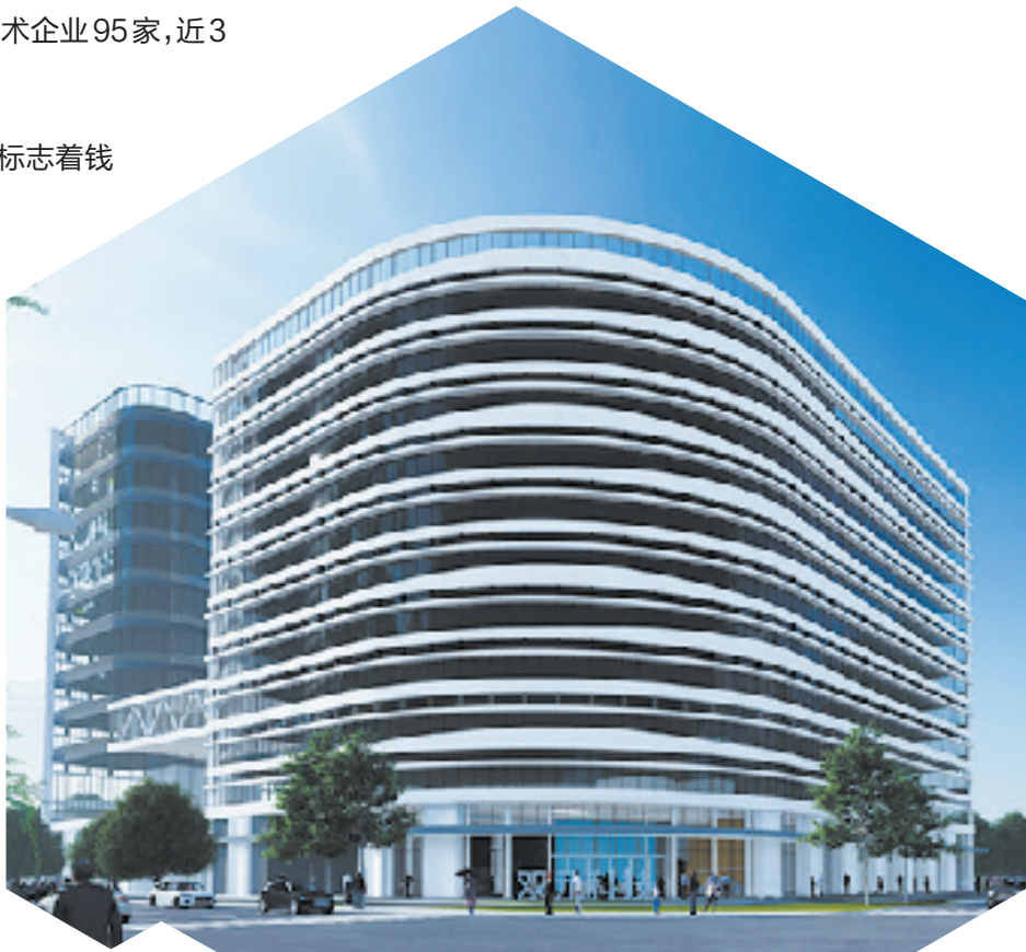
浙江双元科技股份有限公司总部