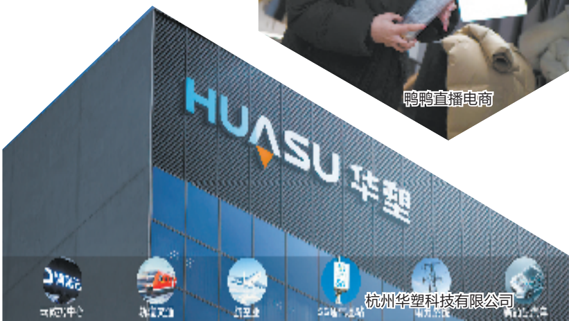
杭州华塑科技有限公司