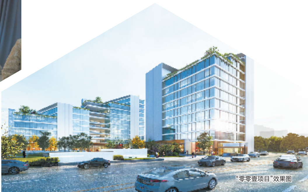
“零零壹项目”效果图