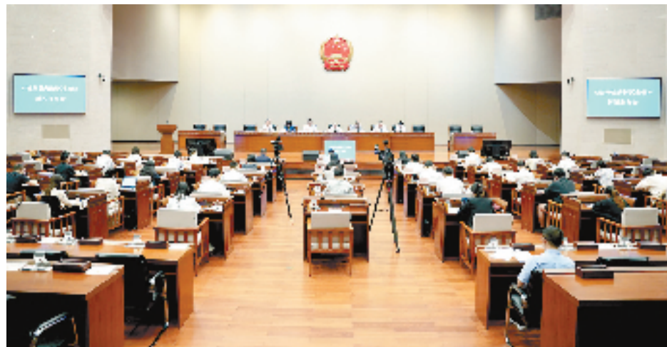
杭州召开新闻发布会宣布《杭州钱塘新区条例》落地。

有了一个良性循环的环境,创新发展便有了涌动不息的活力。不久前举办的第八届中国杭州大学生创业大赛总决赛上,来自萧山、钱塘、富阳、临安等赛区的创业项目团队激烈角逐,最终,钱塘赛区两个项目包揽前两名。今年一季度,钱塘高新技术产业投资同比增长40.28亿元,增幅达87.6%,位列全市第一。