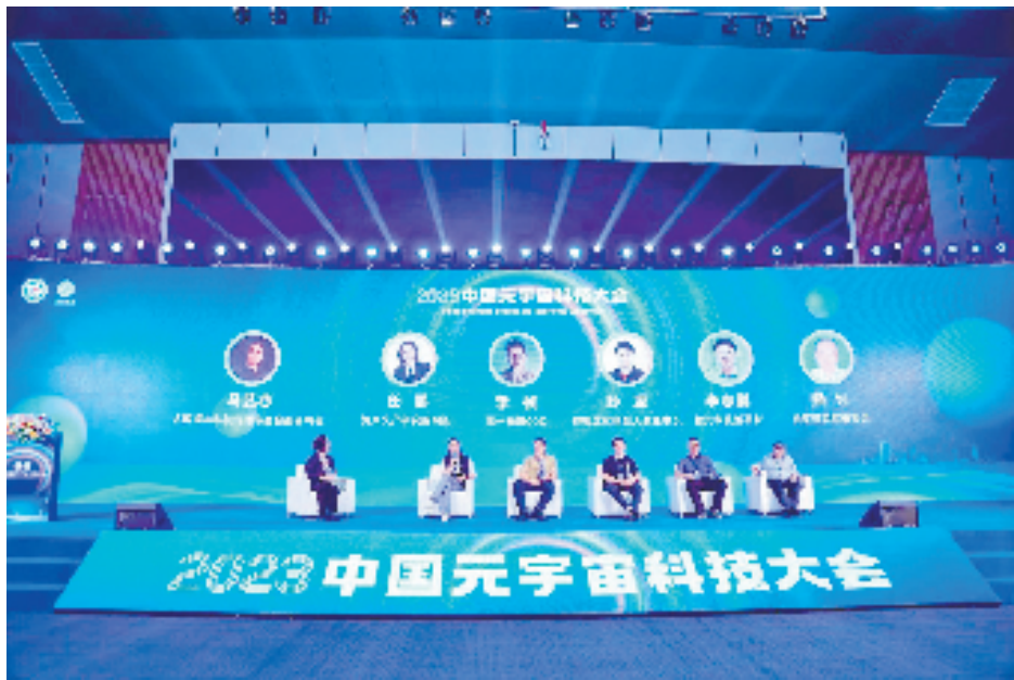
元宇宙成为大创小镇发力的重要方向,图为近日举办的元宇宙科技大会。