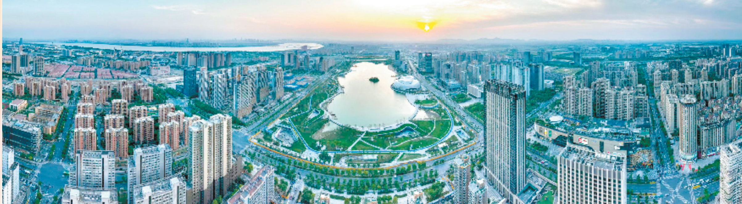
钱塘是浙江首个新区,是杭州制造业体量最大的区。

第一季度,钱塘实现制造业投资46.3亿元,同比增长71.5%,投资总量居杭州第一,获省投资“赛马”激励,勇夺“浙江制造天工鼎”,正以实干实绩交出“半年红”高分答卷。