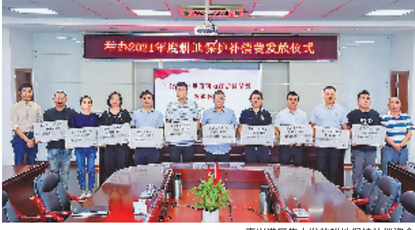
嘉兴港区集中发放耕地保护补偿资金

同时,嘉兴市明确规定,耕地保护补偿资金在完成耕地保护任务和农田水利设施维护后,可用于村集体公益性事业支出,促进共同富裕。据统计,嘉兴市公布的第三批201个实施“强村富民”计划行政村中,经常性收入总数为2.53亿元,其中耕地保护补偿资金为0.8亿元,占比31.7%。补助最多的村为南湖区余新镇金星村,2022年补偿资金为171万元。