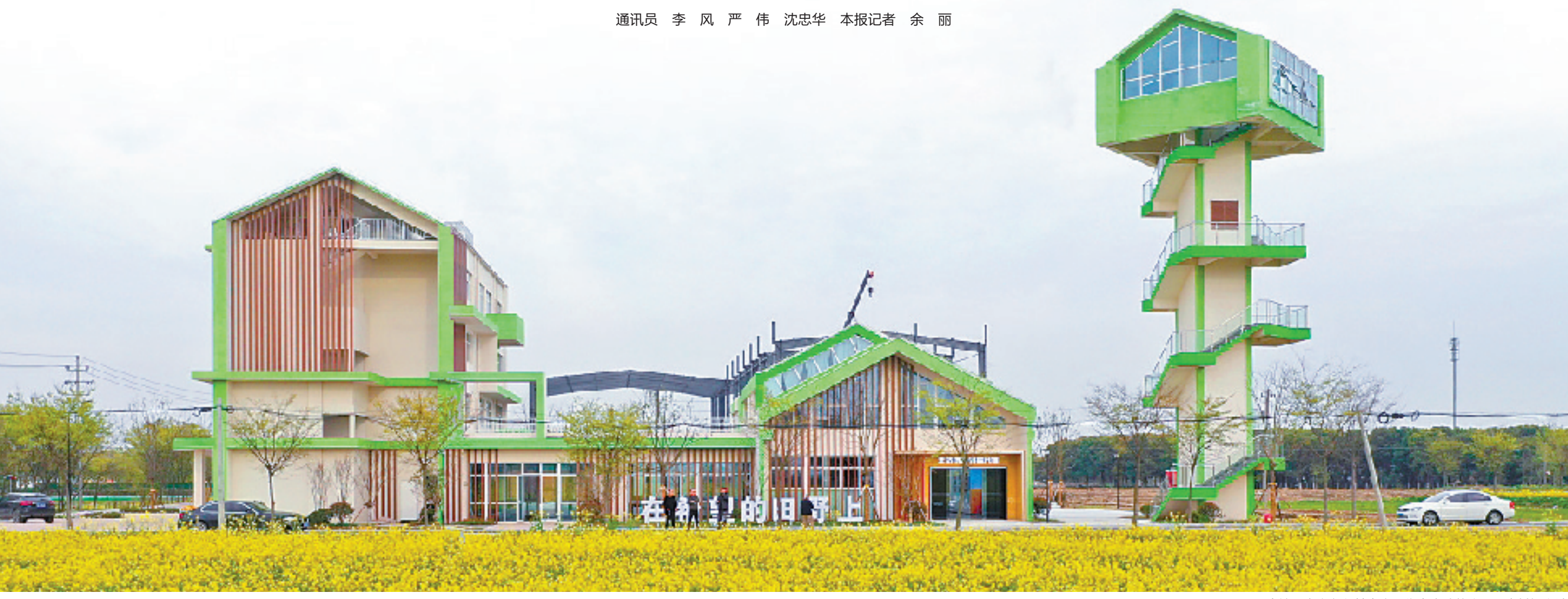
秀洲区王店镇万亩方永久基本农田集中连片整治项目乡村振兴馆

今天是第33个全国土地日,今年的主题是“节约集约用地,严守耕地红线”。尤其是耕地保护,对于嘉兴有着不同寻常的意义。