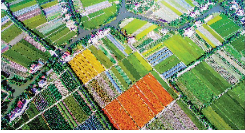
嘉善县大云镇土地综合整治工程

2022年6月24日,第32个全国土地日浙江省主场活动在桐乡市屠甸镇荣星村举行,活动现场讲述了这样一个故事:6月21日,桐乡市自然资源和规划局工作人员在“耕地智保”平台发现,在凤鸣街道新农村村的一块耕地上,一辆挖掘机正在施工。平台对这块耕地的数据进行自动研判分析后,认定存在疑似破坏耕地的行为。巡查员收到这一预警信息后,立即赶到现场察看,了解到这台挖掘机正在复耕施工情况。由于不存在违法违规行为,巡查员便拍照上传至“耕地智保”应用场景,这块耕地的空间码就由黄码变成了绿码。从预警到解除预警,整个过程仅用了约半个小时。