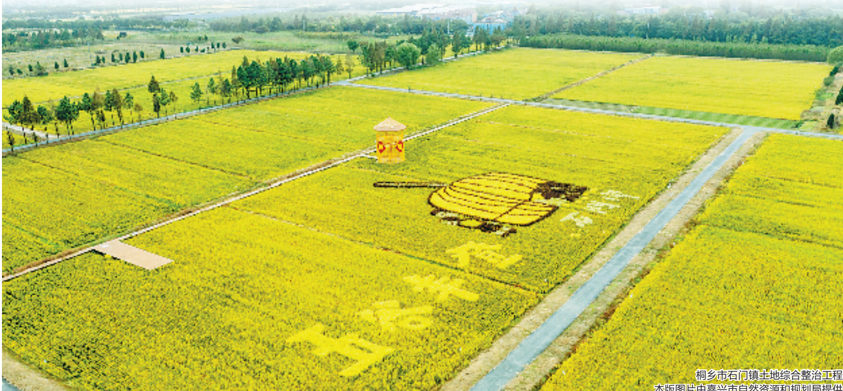
桐乡市石门镇土地综合整治工程

今天,嘉兴迎来第33个全国土地日。“我们必须以高度的政治自觉和强烈的责任担当,切实抓好耕地保护,扎实推动土地综合整治,确保耕地保护一分不少、违法占地一寸不让,全力打造耕地保护示范市,为嘉兴经济社会高质量发展提供有力支撑。”嘉兴市政府主要负责人表示。