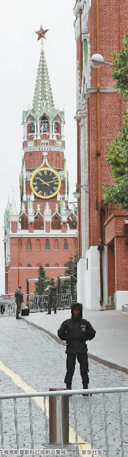
6月24日,执勤人员在俄罗斯莫斯科红场附近警戒。

俄新社当天援引俄罗斯车臣共和国领导人卡德罗夫在社交媒体上的发文报道,车臣部队和俄国民近卫军已前往紧张地区,将尽一切努力维护俄罗斯统一并保护俄国家地位。卡德罗夫强调,叛乱必须被镇压,“如需采取强硬措施,车臣战士已为此做好准备”。 (本报综合新华社消息)