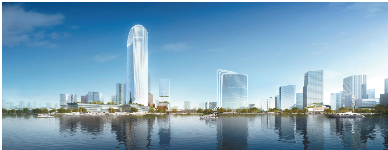
南太湖未来城效果图