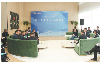
亲清直通车·政企恳谈会

以环湖州高铁站区域为青创核心，湖州科技城和西塞科学谷（北片）为两翼，围绕中节能湖州智能科学中心等十