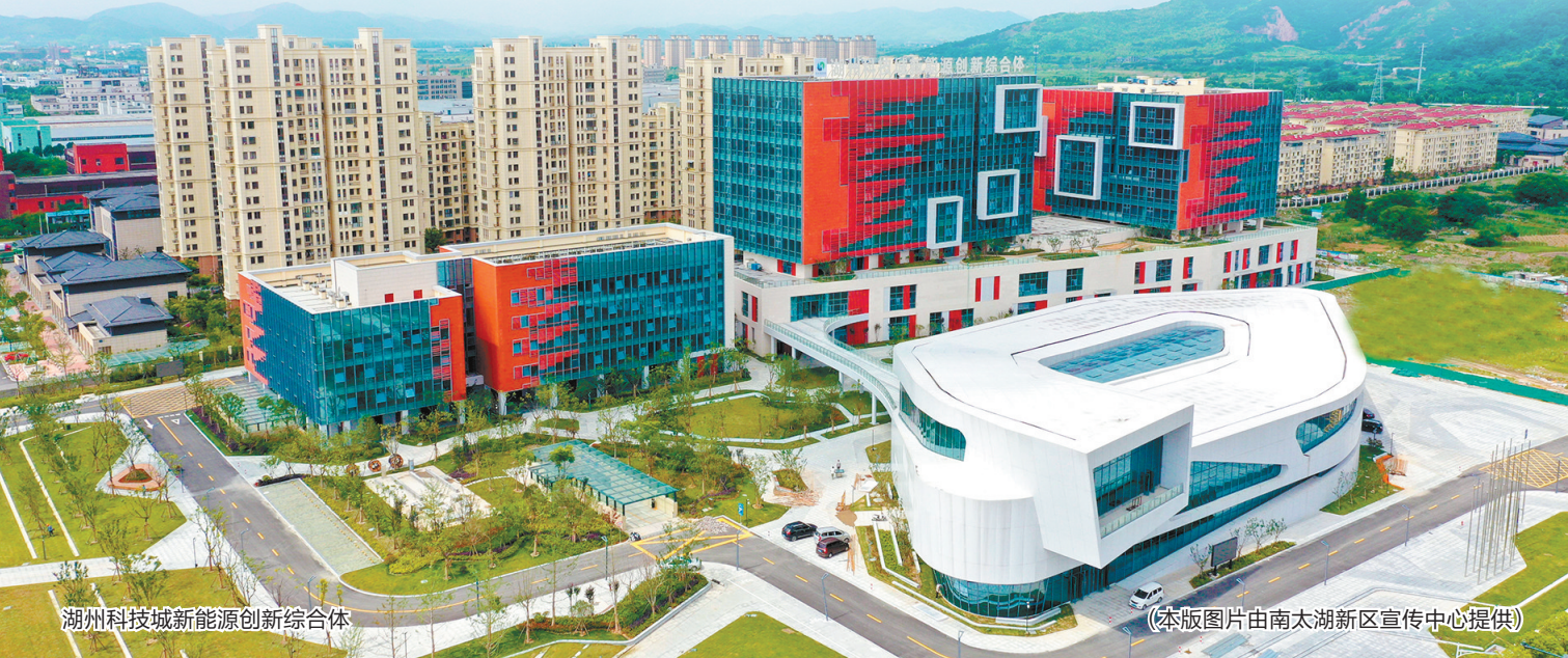
湖州科技城新能源创新综合体