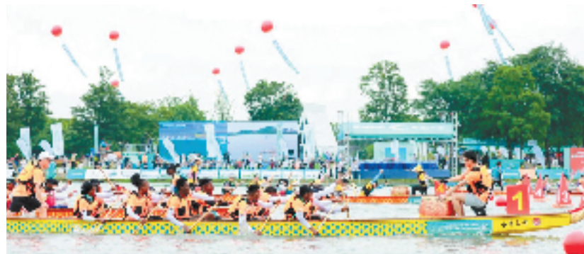
2023年中国名校水上运动公开赛暨吴兴西山漾第五届水上运动嘉年华