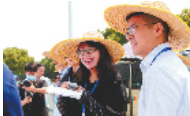
市民观察团实地考察人行道铺装整治情况

拼工作。14个乡镇街道选取最需本地发展突破、最具本地发展特色、最显本地发展成效之事,以一年做成“一件事”的决心列清单、定目标、抓落实,打造兼具显示度、辨识度、美誉度的标志性点位,推动全区经济社会高质量发展。