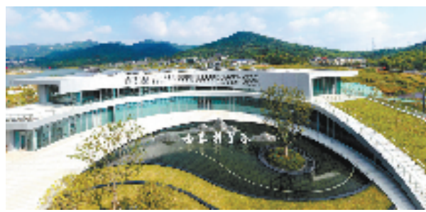
西塞科学谷

● 扎实推进“大救助一站式”服务模式,深化困难群众精准帮扶,2022年共发放救助资金6219万元。