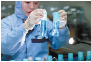
美妆小镇里的美妆企业生产车间

今年以来,在贯彻落实湖州市委、市政府“在湖州看见美丽中国”标志性点位“四季看变化”工作部署基础上,吴兴区锁定拼经济、优民生、美城乡3条赛道,创新开展“一件事”擂台赛比