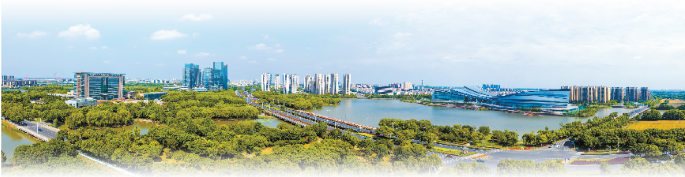
东部新城

太湖南岸,20岁的吴兴正青春。 不负韶华,以梦为马。近一年来,吴兴区坚持“市区一体、奔跑赶超”,全面投身“在湖州看见美丽中国”实干争先主题实践,奋力在绿色低碳共富社会主义现代化新湖州建设中打头阵、挑重担。欣欣向荣的新青年城市迎面而来。