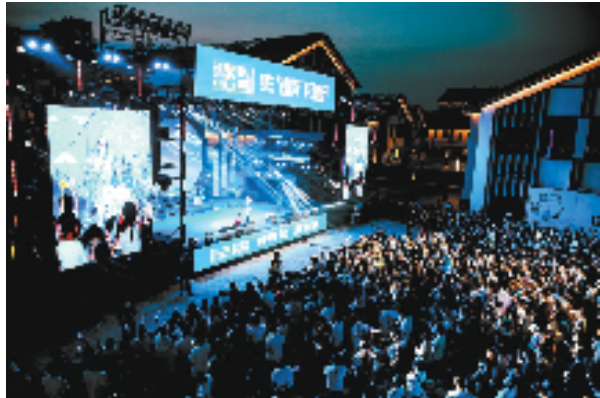
青年人才音乐节

区领导带头领衔、靠前指挥,部门工作前移、标准上靠,镇街和村社因地制宜、扬优成势……全员竞跑,赛出了新面貌,“事事马上办、人人钉钉子、个个敢担当”蔚然成风,以实干的作风把群众的“急难愁盼”“关键小事”以及产业发展、乡村振兴、共同富裕等各项工作落到实处。