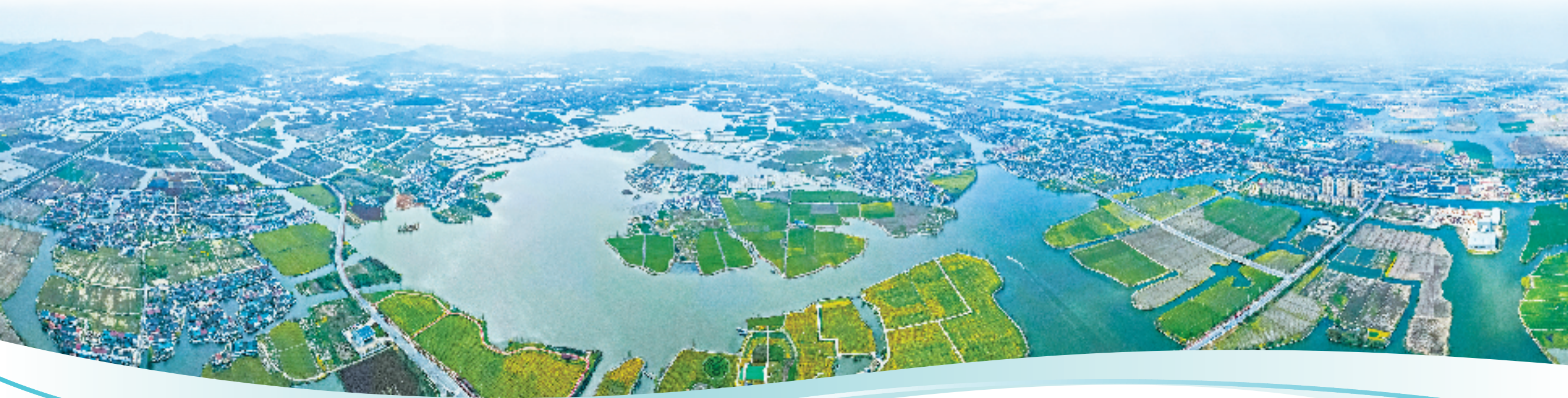
航拍鉴湖国家湿地公园

田园变公园、村庄变景区、农房变客房、资源变资产。美丽乡村催生出多元新兴业态，带动了当地农民共同发展。2022年，越城区农村居民人均可支配收入达到45540元；城乡居民人均可支配收入倍差仅1.55，该项指标常年位居绍兴市第一、全省前列。