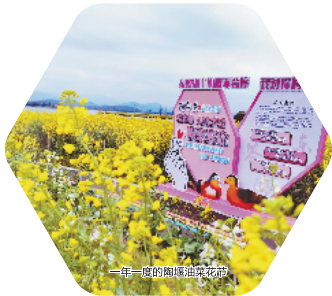
一年一度的陶堰油菜花节

19261亩。优质的农业基础和广阔的土地发展空间吸引了农业巨头前来布局。2021年6月，全省最大农旅综合体项目——敏实生物农业示范园项目落户孙端。项目总占地约8300亩，总投资3亿美元。在粮食作物种植基础上，将规划发展水产养殖、蔬菜、瓜果、家禽等项目，并按绿色有机标准进行种养。