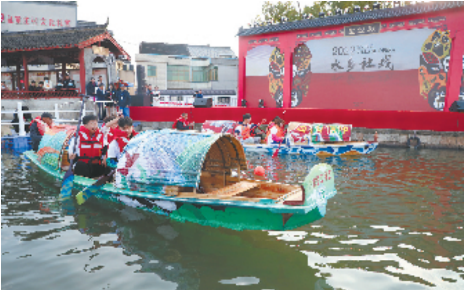
孙端皇甫庄的水乡社戏

酒香也怕巷子深，环境越来越好，基础越来越扎实，但如何吸引更多的人知道富盛、走进富盛成了新课题。为此，富盛镇积极探索品牌效应，依托生态优势和文化资源，接连举办了“富盛抹茶马拉松”“富盛春笋节”等文旅节会活动，带动了特色酒店、精品民宿、研学基地、共富驿站等一系列共富产业落地，让更多村庄在“千万工程”的指引下，不断拓宽“绿水青山”向“金山银山”转化通道，以农文旅融合的模式，实现更好发展。