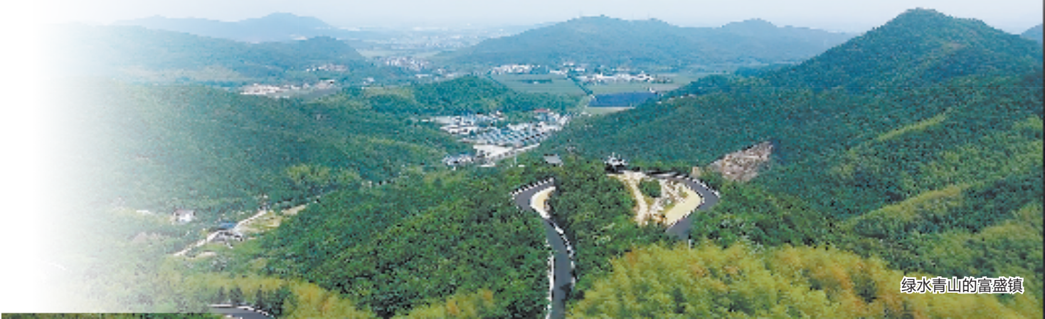
绿水青山的富盛镇