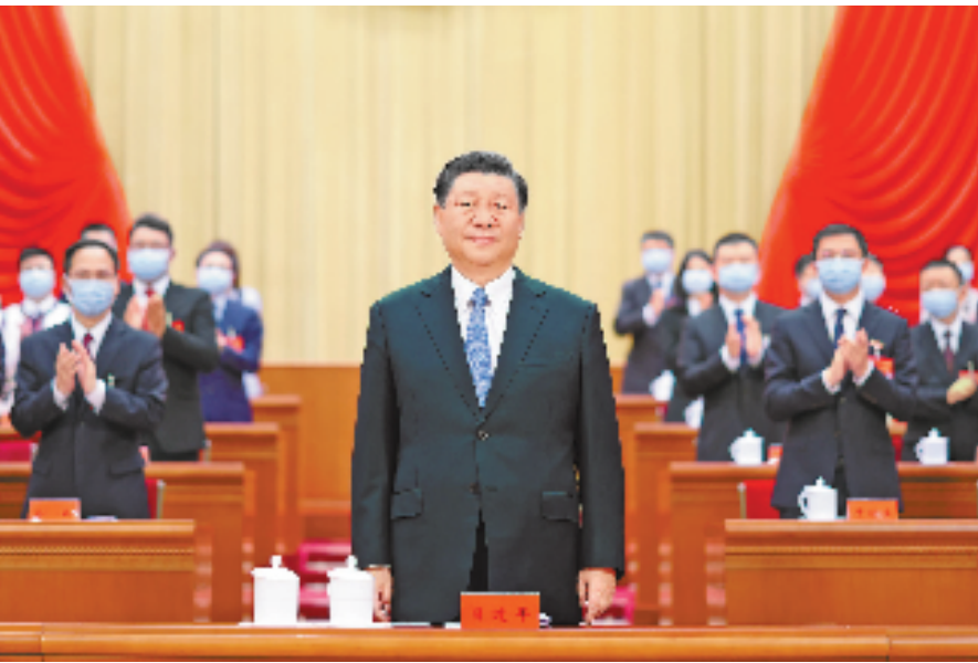
6月19日,中国共产主义青年团第十九次全国代表大会在北京人民大会堂开幕。这是中共中央总书记、国家主席、中央军委主席习近平在主席台向与会代表致意。