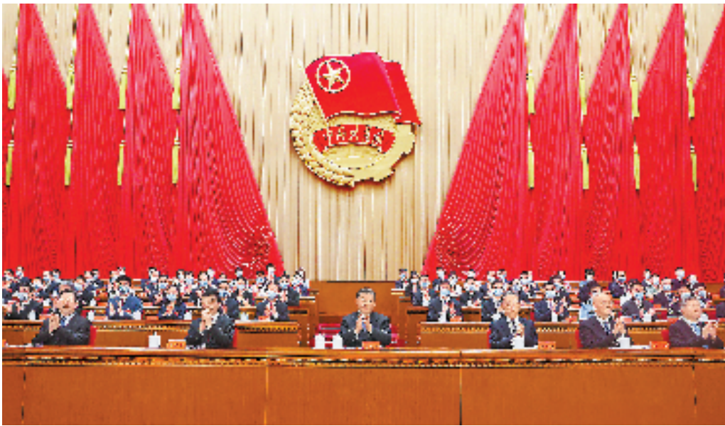
6月19日,中国共产主义青年团第十九次全国代表大会在北京人民大会堂开幕。习近平、赵乐际、王沪宁、蔡奇、丁薛祥、李希等在主席台就座,祝贺大会召开。

新华社北京6月19日电 中国共产主义青年团第十九次全国代表大会19日上午在人民大会堂开幕。习近平、赵乐际、王沪宁、丁薛祥、李希等党和国家领导人到会祝贺,蔡奇代表党中央致词。