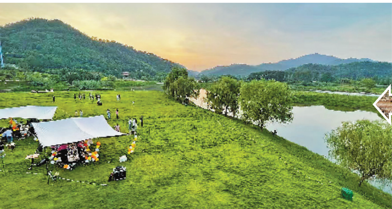
在采砂厂旧址上,坛头村新建了露营地。