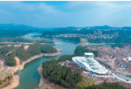
天顶湖国际旅游度假区

成持续开展畜禽养殖综合整治，主动拒绝100多家企业入驻，累计拒绝200多亿元的工业投资。