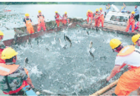
珊溪水库捞捕包头鱼

且看一组数据：1997年，保障温州700多万人用水的珊溪水库选址文成开始建设后，全县95%的辖区列入水库保护地红线范围。从那时起，文成坚持守好“一缸净水”，对不符合生态功能的项目“一票否决”。20多年来，文