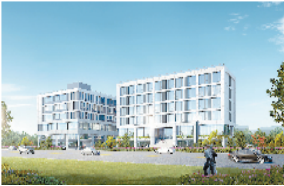
味多多预制菜项目效果图

文成传统养殖包头鱼，年产 300吨 ，2022年活鱼销售 33万斤 ，实现销售收入 535万元 。 文成全县稻渔综合种养面积达 4660亩 ，创成省级稻渔综合种养精品园 1家 、省级稻渔综合种养示范基地 3家 。