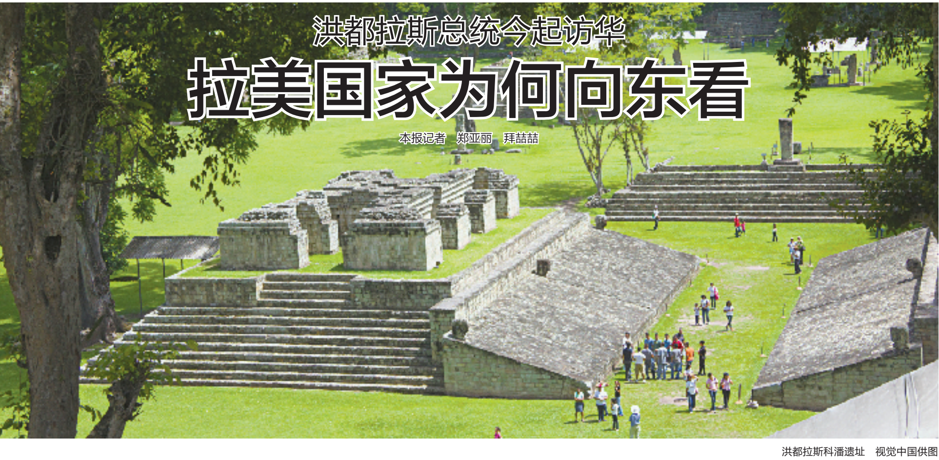
洪都拉斯科潘遗址

外交部发言人华春莹7日宣布:应国家主席习近平邀请,洪都拉斯共和国总统伊丽丝·希奥玛拉·卡斯特罗·萨缅托将于6月9日至14日对中国进行国事访问。 今年3月25日,洪都拉斯外交部发表声明,宣布与台湾断绝所谓“外交关系”。次日,中洪建交公报签署,中国和洪都拉斯正式建交,两国关系翻开了崭新的历史篇章。此访是洪都拉斯总统首次对中国进行国事访问,两国元首将举行历史性会晤,共同规划和引领中洪关系未来发展。 中拉合作正在不断注入新动力,近年来,巴拿马、萨尔瓦多、多米尼加、尼加拉瓜等国相继同中国建立或恢复外交关系后,双边务实合作快速发展。 相隔万余公里,拉美国为何纷纷“向东看”?