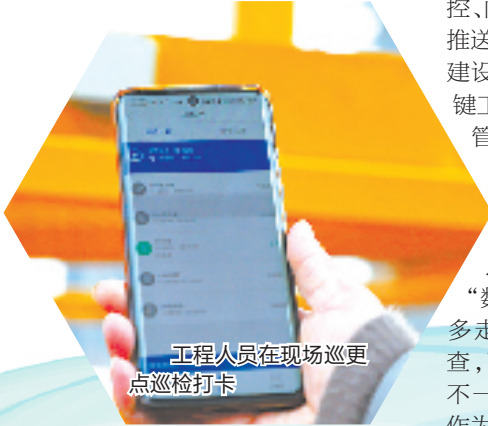
工程人员在现场巡更点巡检打卡

今年，嘉湖区域公司在建项目达到8个，其中2个项目面临集中交付挑战。在快速发展壮大的同时，如何践行打造高质量宜居产品的“初心使命”？嘉湖区域公司以数字化赋能、规范化管理、品质化管控、阳光化监督四大举措给出了自己的答案。