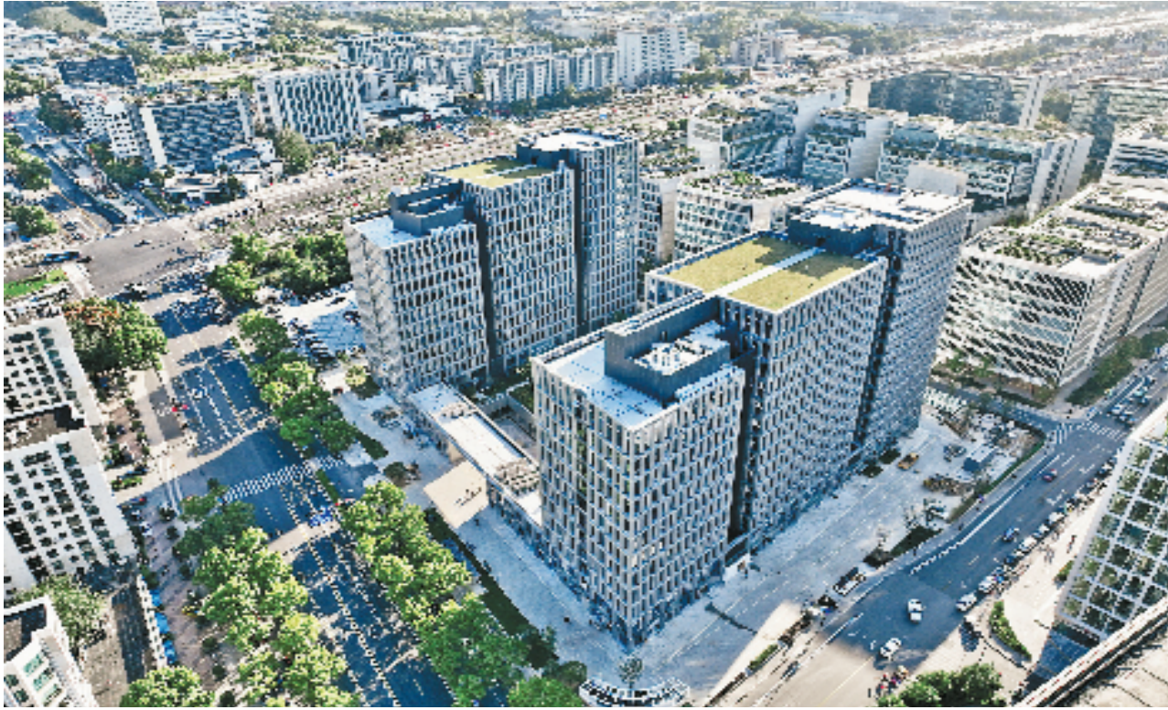
西湖区古荡街道加快打造“数字经济第一街”

抓招商，新招迭出。今年3月，古荡街道会客厅将正式启用。这个集对外展示、招商洽谈、项目路演、为企业服务等功能于一体的“服务窗口”，不仅为辖区内优秀人才和创业团队营造孵化环