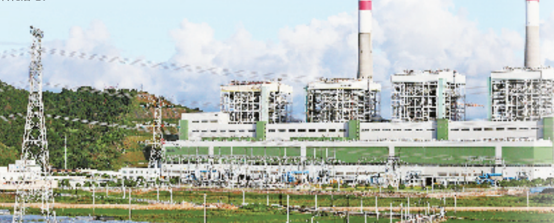
点“碳”成“金”！工行创新推出碳排放配额抵押贷款。图为工行支持的浙江浙能乐清发电有限公司。