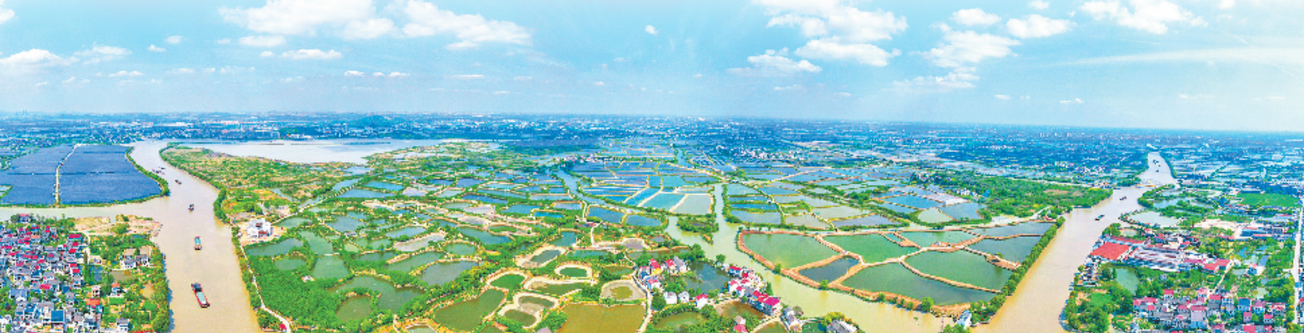
工行浙江省分行致力推动高质量发展的绿色金融，有力有效支持浙江经济社会绿色低碳转型。

建设绿色浙江，必须坚定不移走可持续发展之路。中国工商银行浙江省分行始终扛起服务实体经济高质量发展的大行担当，积极探索金融支持绿色发展的“工行模式”。尤其是近年来，在国家“双碳”目标指引下，该行提高政治站位，强化责任担当，坚持新发展理念，绿色信贷余额自2018年底的534亿元，增长至2022年底超2500亿元，近5年年均增量近450亿元，绿色金融发展驶入快车道。