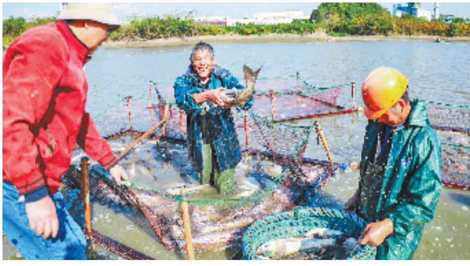
工行助力提升生物多样性保护，带动湖州渔旅产业链发展。

绿色征途，永不止步。未来，工行浙江省分行将把绿色金融放在更突出的战略位置，以金融引领绿色发展、服务实体经济为主线，坚定不移朝着“绿水青山就是金山银山”的路子走下去，持续推动浙江生态文明建设和经济社会可持续发展，为奋力推进“两个先行”作出更大贡献。