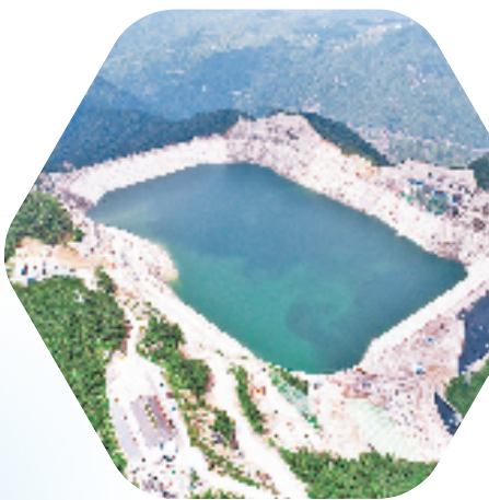
工行支持的湖州长龙山抽水蓄能项目

不仅如此，为推进山区特色优势资源转化落地，工行还为缙云壶镇70兆瓦农光互补光伏发电项目累计投放1.38亿元。该工程位于缙云山区区域，“上面发电、下面种植、科学开发、综合利用”的“农光互补”建设模式，不额外占用土地。项目建成后，每年可减少二氧化碳排放2.69万吨，有助于改善当地电源结构，具有良好的社会效益和综合经济效益。