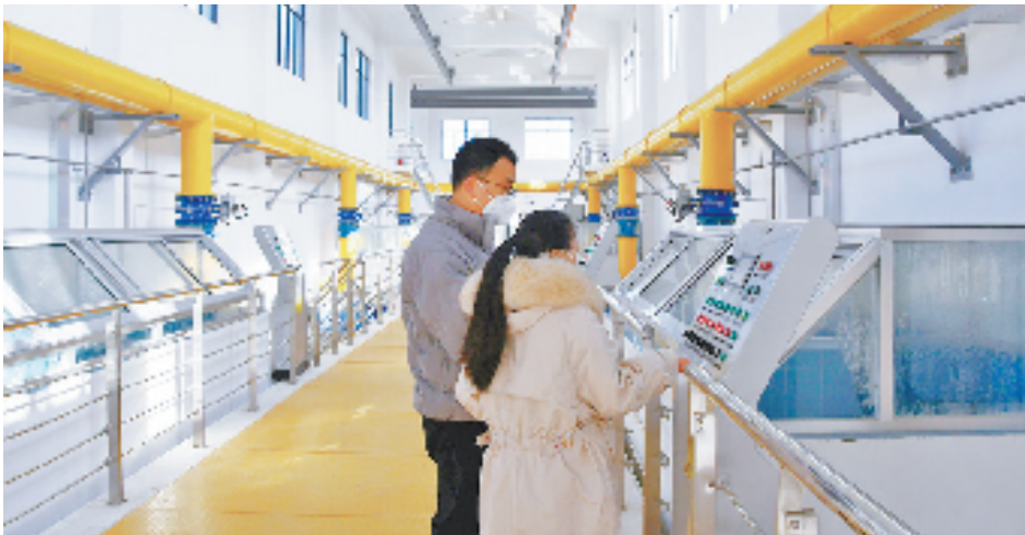
工行台州玉环支行客户经理(左)调研玉环南部湾饮水工程设备运行情况