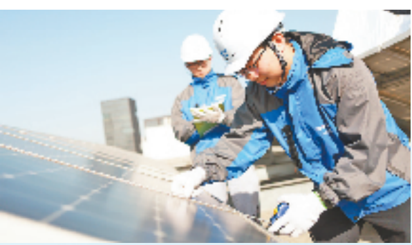
工行为光伏发电项目投入资金支持，推进山区特色优势资源转化落地。

在浙西南丽水，围绕“零碳金融网点”创建思路，工行丽水分行营业部采取技术上可行、经济上合理的方法，推进电子无纸化办公和“智慧网点”建设，将绿色发展理念深植日常运营管理。2022年3月，该网点获评首批丽水市银行业零碳金融网点，这也是工行浙江省分行系统内首家零碳金融网点。