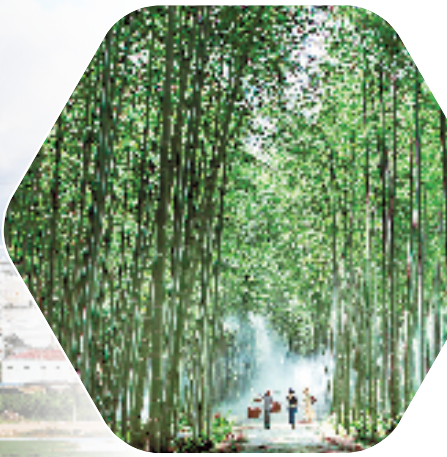
工行加快碳金融产品创新开发，为浙江竹碳汇产业发展注入金融活水。