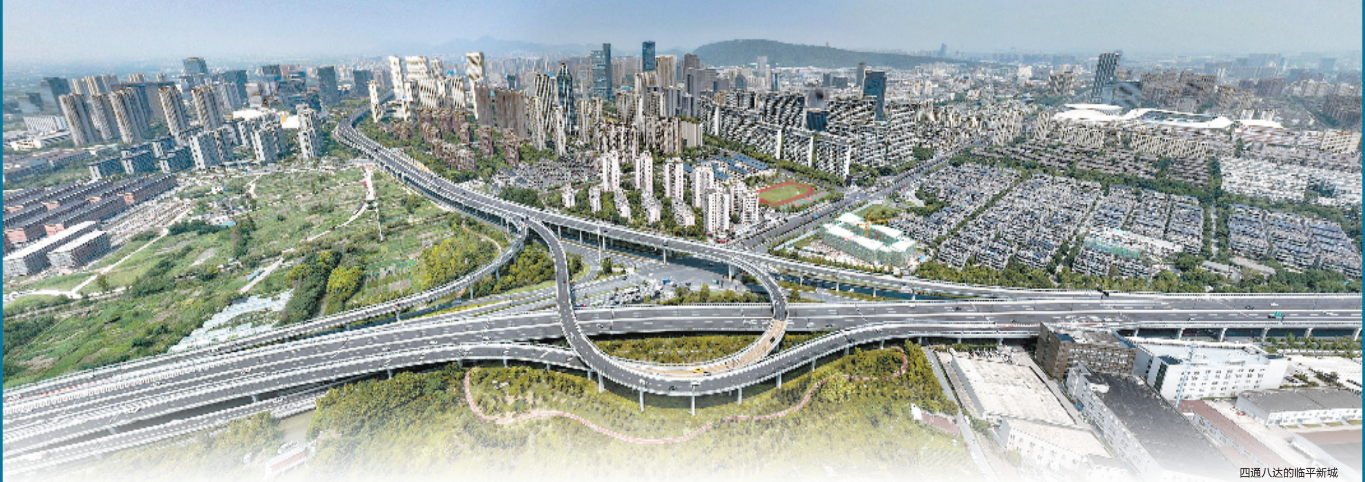
四通八达的临平新城