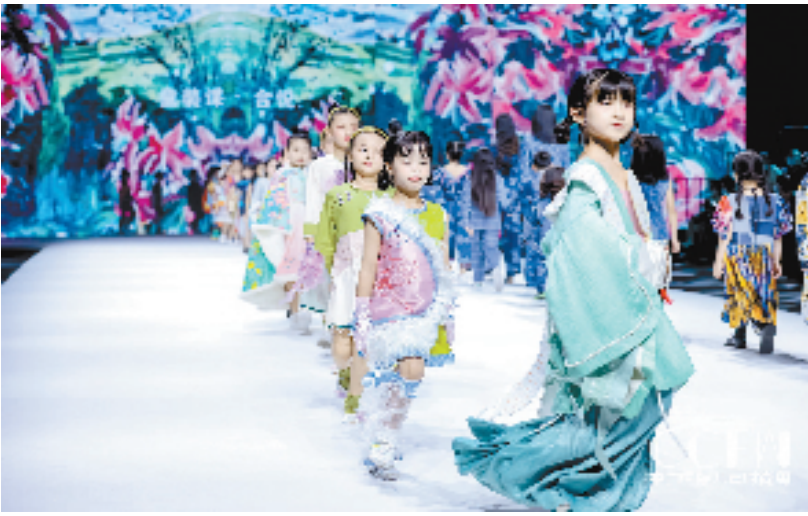
在艺尚小镇举办的中国国际儿童时尚周