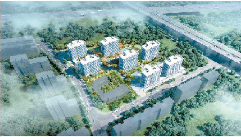
共有产权房开工建设