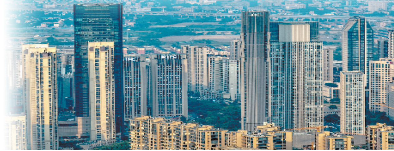
临平新城的城市楼宇

2023年,是临平新城全域提速发展的关键之年。胸怀高质量发展的目标,手握“三把利剑”,临平新城将在决战之势下奋起实干,在新时代新征程中展现新作为新担当。