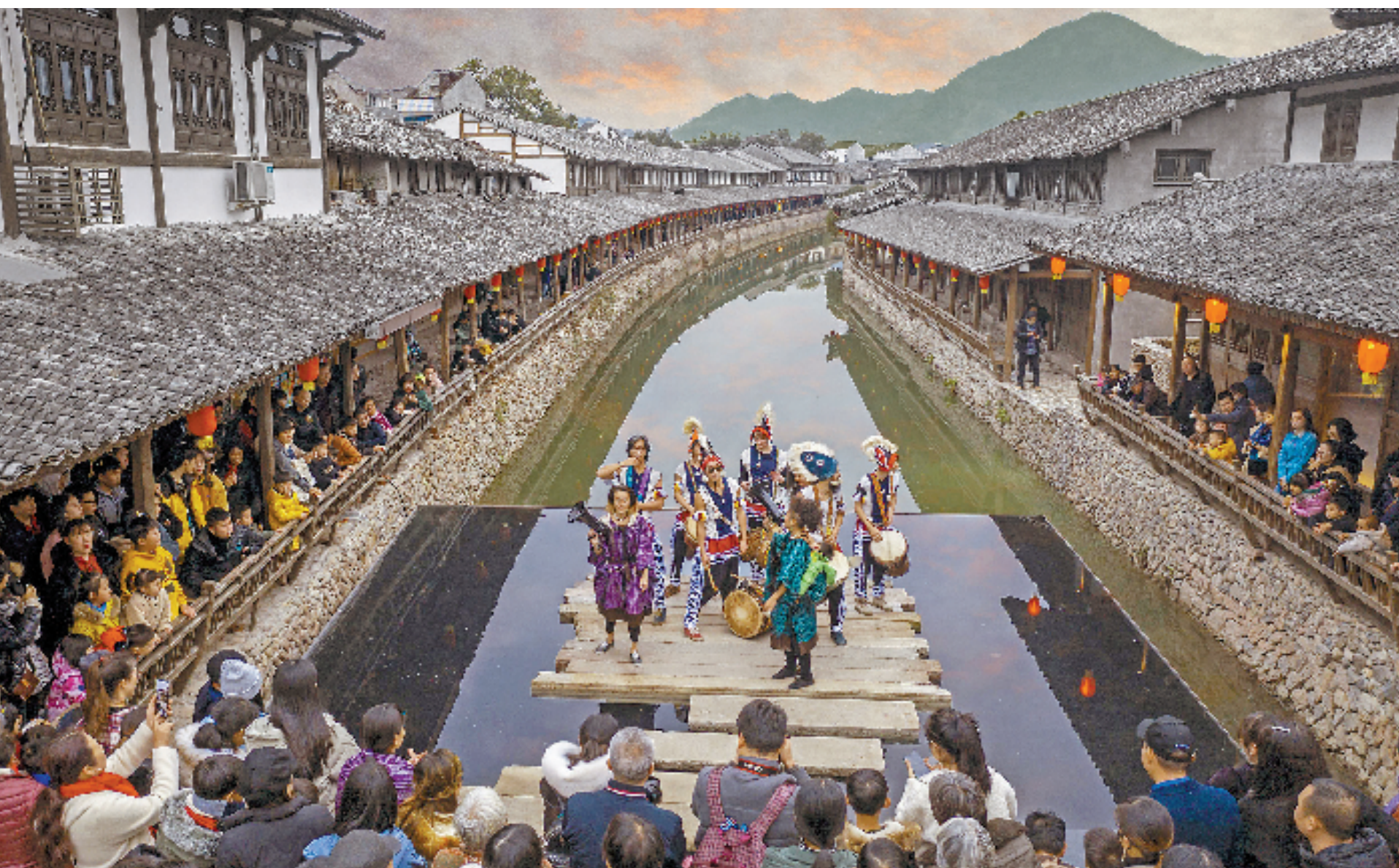
永嘉县丽水街社区

从一穷二白的“移民村”蝶变成美丽乡村,白沙村通过打造集军事旅游、军事文化、军事教育于一体的红色旅游项目吸引游客。