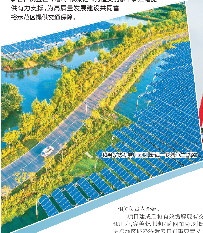
和孚光伏发电片区(和新线-荻港渔庄公路)

南浔将全面做好内畅外联“融沪大通道”建设篇章,充分发挥交通在全方位融沪发展中的基础性、先导性、战略性作用,为全面建设“湖州市接轨上海创新合作试验区”,唱响“双城记”,打造美丽繁华新江南提供有力支撑,为高质量发展建设共同富裕示范区提供交通保障。