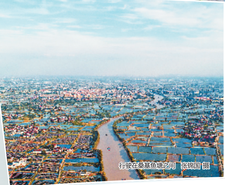
行驶在桑基鱼塘之间