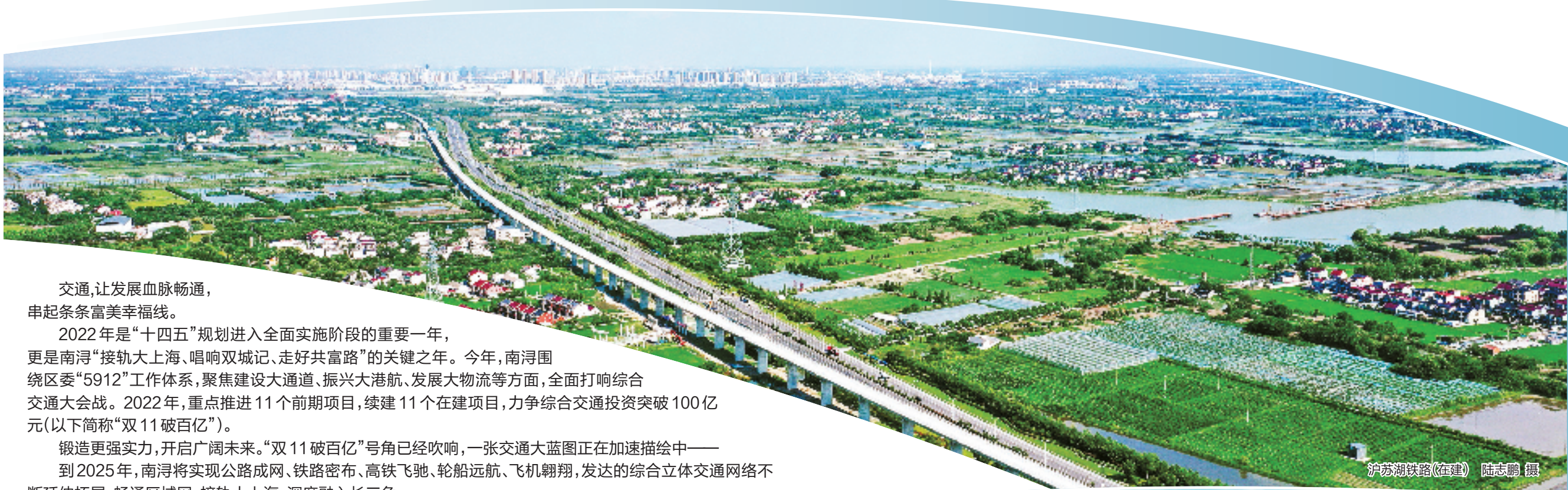
沪苏湖铁路(在建) 陆志鹏 摄