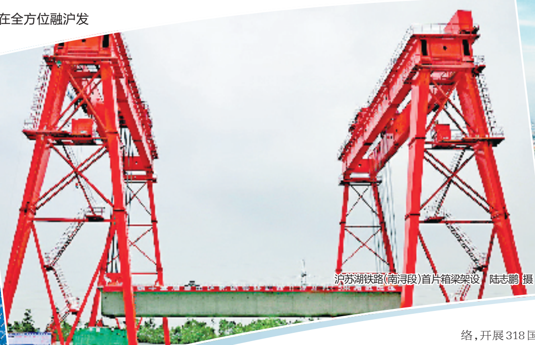
沪苏湖铁路(南浔段)首片箱梁架设