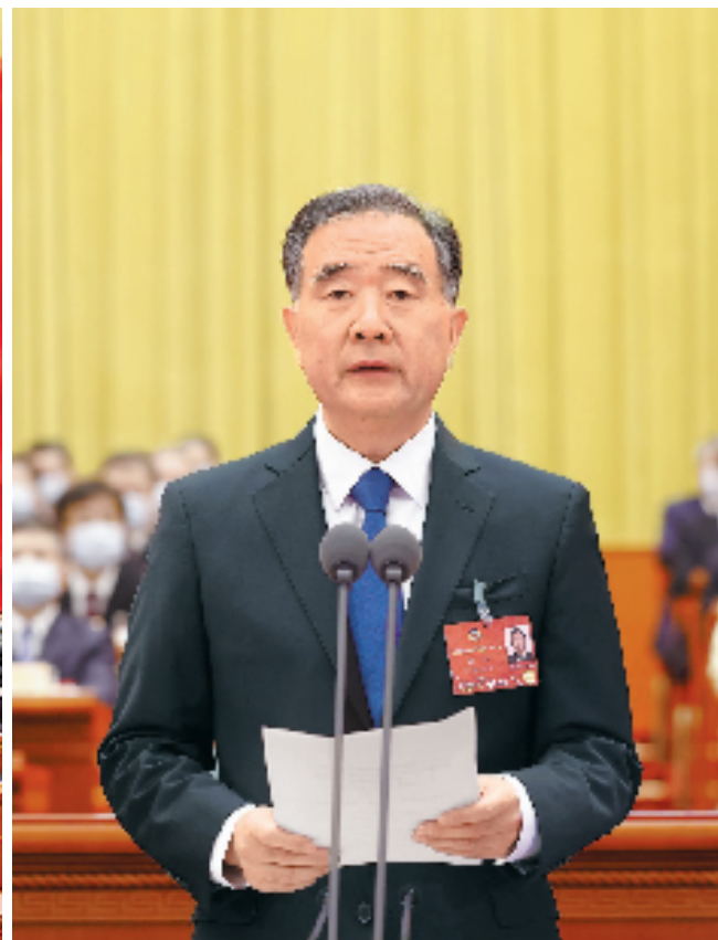
全国政协主席汪洋主持闭幕会并发表讲话。

泛汇聚正能量,开出满满精气神,是一次高举旗帜、民主团结、求真务实、简约高效的大会。中共中央总书记、国家主席、中央军委主席习近平等党和国家领导同志出席大会开幕会和闭幕会,深入界别小组