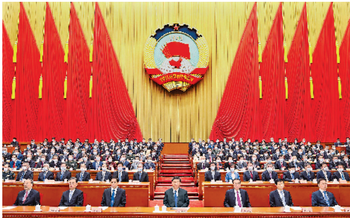
3月10日,中国人民政治协商会议第十三届全国委员会第五次会议在北京闭幕。习近平、李克强、栗战书、王沪宁、赵乐际、韩正、王岐山等在主席台就座,汪洋主持闭幕会并发表讲话。