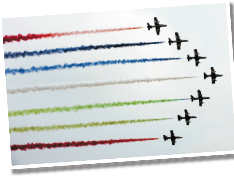
11月12日,阿联酋“骑士”飞行表演队在进行表演。