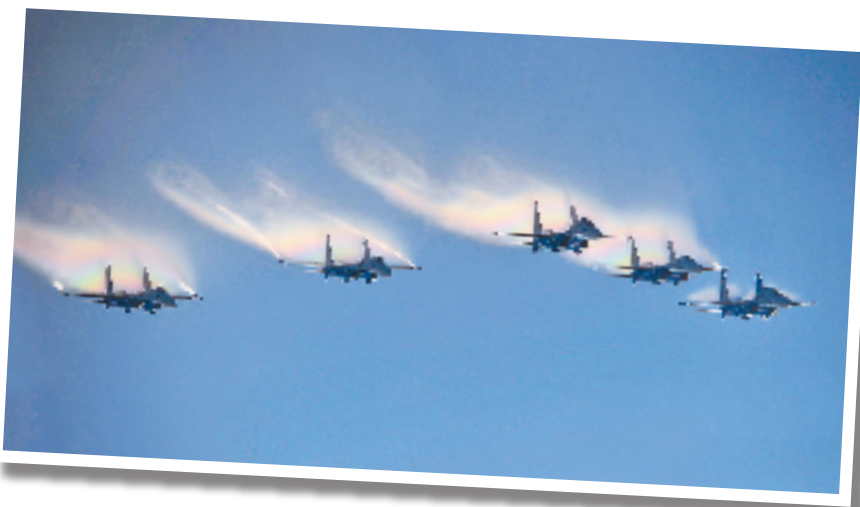
11月15日,俄罗斯“勇士”飞行表演队在编队俯冲时产生美丽的彩虹水雾。