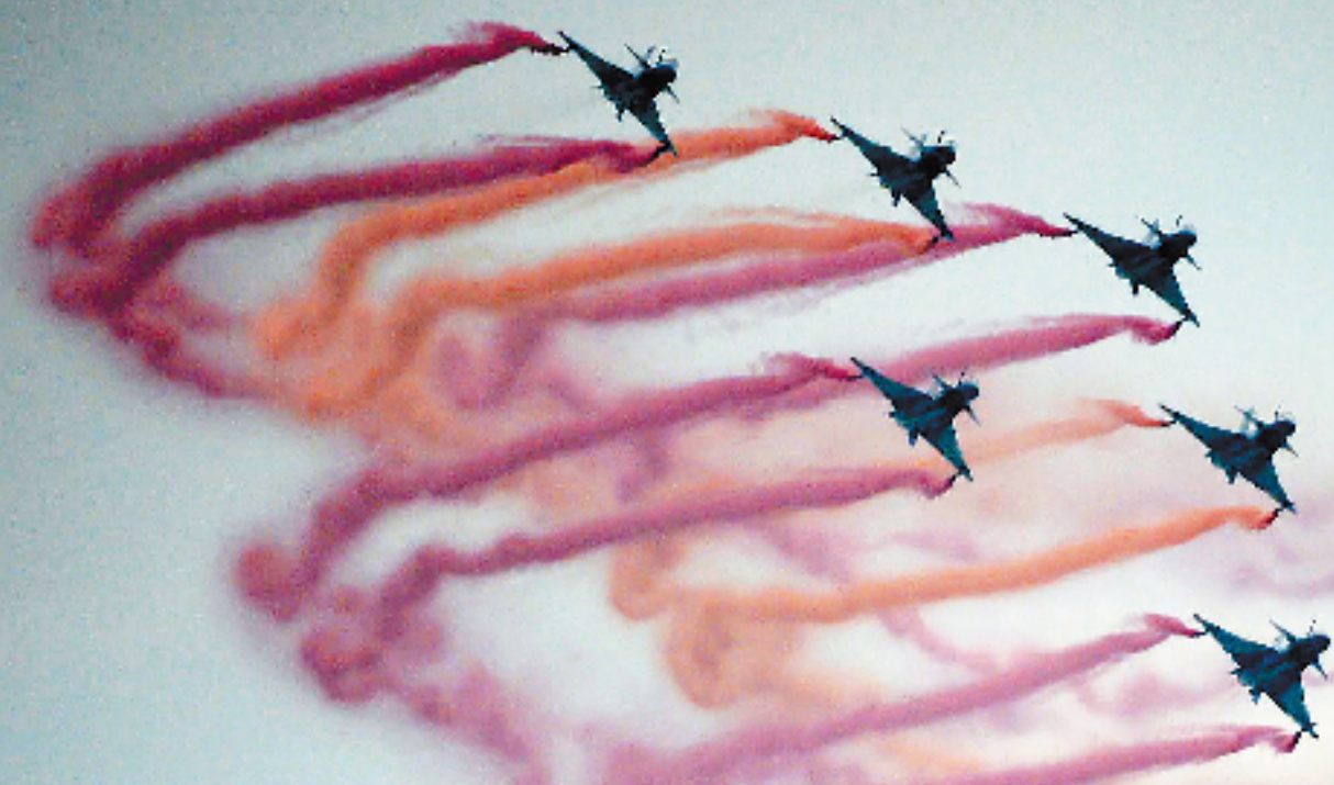
中国空军八一飞行表演队。