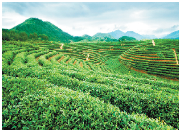
龙泉金观音长寿茶叶

经济,打造长寿品牌,是把绿水青山转换为金山银山,提高龙泉知名度美誉度,推进龙泉绿色崛起、科学跨越的重大战略抉择。打好了这张名片,可以增强龙泉百姓的幸福指数,增添龙泉的文化软实力,增加诸多农产品的长寿附加值,在为文化产业、生态休闲旅游业、房地产业、养生养老产业和医疗保健业等产业提供新的发展机遇同时,也为龙泉经济社会健康持续发展开辟新的空间。”龙泉市委主要负责人对此信心十足。