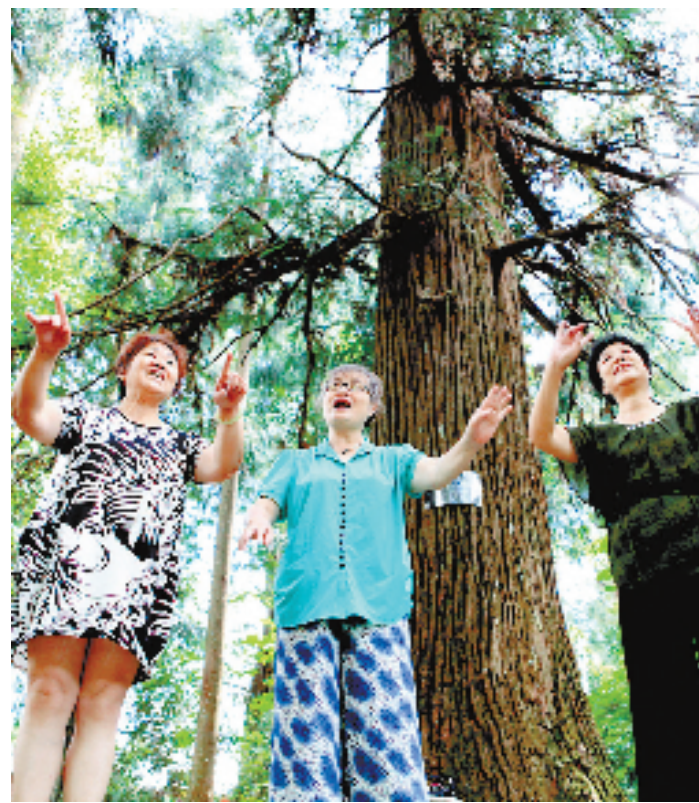
华东古树第一村——柳山头

负氧离子含量平均在4860个/立方厘米,最高达10万个/立方厘米以上,远远超过1000个/立方厘米的保健浓度,达到最高级别的“特别清新”标准,生态气候非常适合养生养老。龙泉是森林之城:龙泉是浙南林海,森林覆盖率达84.2%,绿色覆盖3000公里,全年日照指数强,山地、丘陵基本没有污染,土壤肥沃品质好,为美食养生提供优质食材。