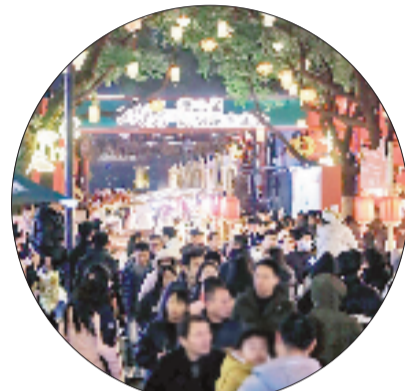
欢腾·第三届山阴城隍庙会

阴城隍庙会活动期间，日均人流量达10.3万人次，同比增长23.6%，累计带动周边消费超5200万元。