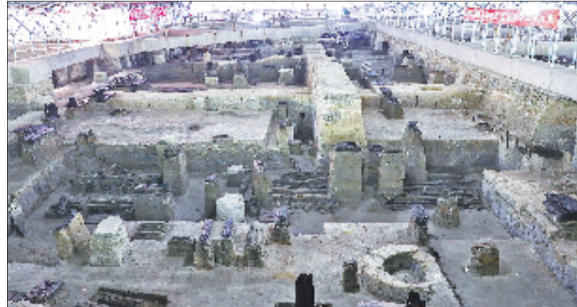
稽中遗址，东周和汉六朝时期建筑基础（由北向南）。