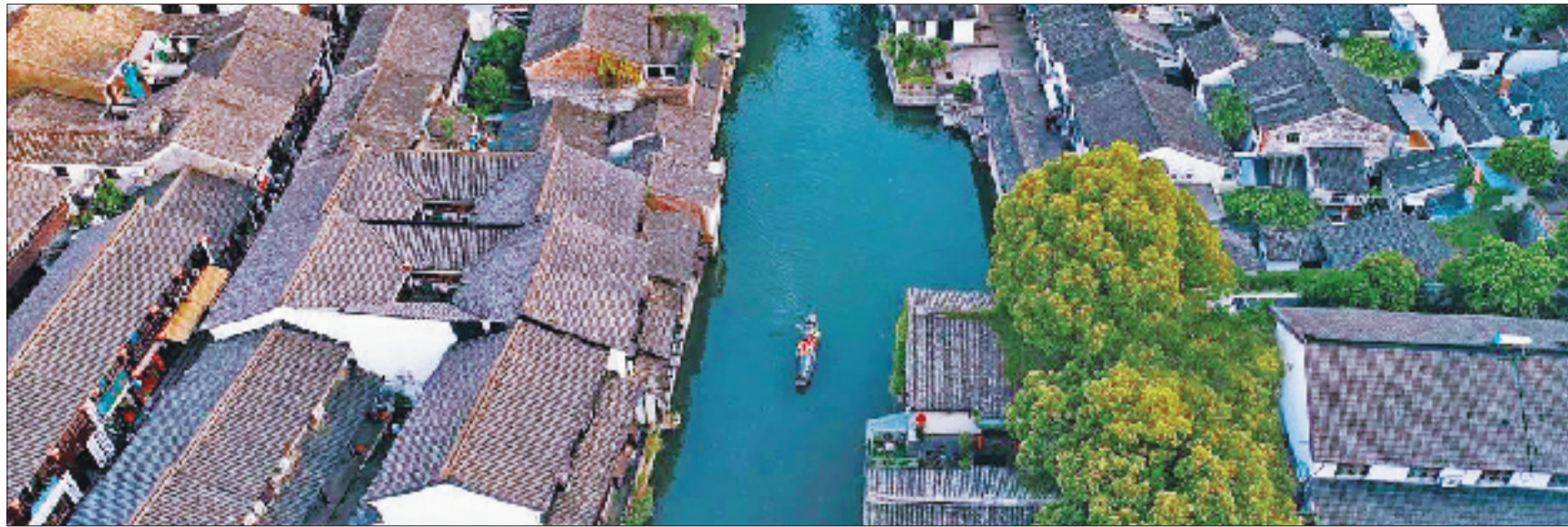
越子城历史文化街区