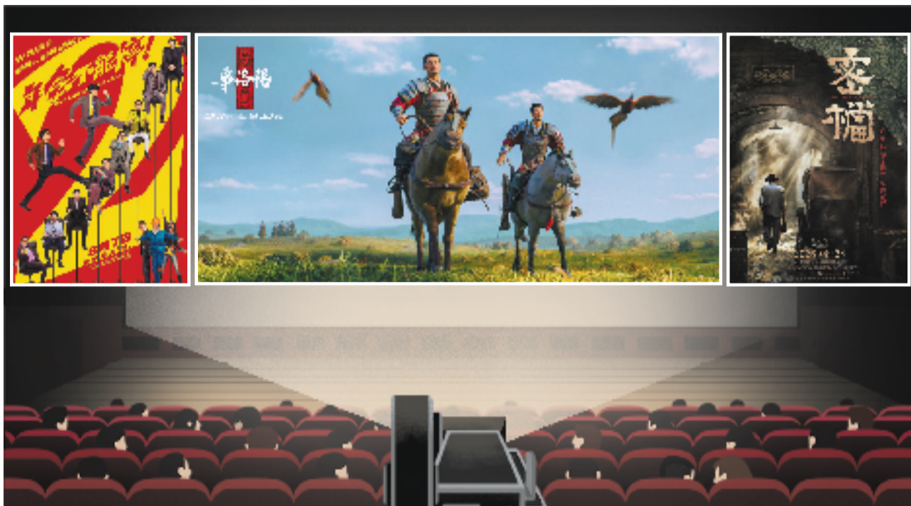
今年暑期档影片包括《年会不能停2!》《三国第一部:争洛阳》《密档》等。

纪之后出生的年轻观众群而言,周星驰既熟悉又陌生,这需要周星驰为其新片注入更年轻、与时俱进的元素,才能够在暑期档赢得更多青睐。