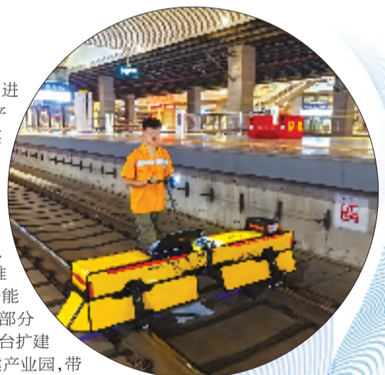
祥和智能铁路轨道综合检查仪在郑州东站检测铁轨。

从一家企业到一群企业，从一个产业到一个生态，以“和合”之道，这座山区县走出了从“零的突破”到“群星闪耀”的蝶变之路。