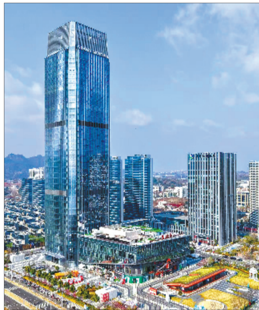
天台总部经济大楼

从儒释道的“和合共生”，到合成生物的“一念合成”；从寒山子脚下的芒鞋，到飞向低空的无人机……天台，始终在“修行”，也始终在“破圈”。这里既守得住千年的文脉，也闯得出时代的新路。