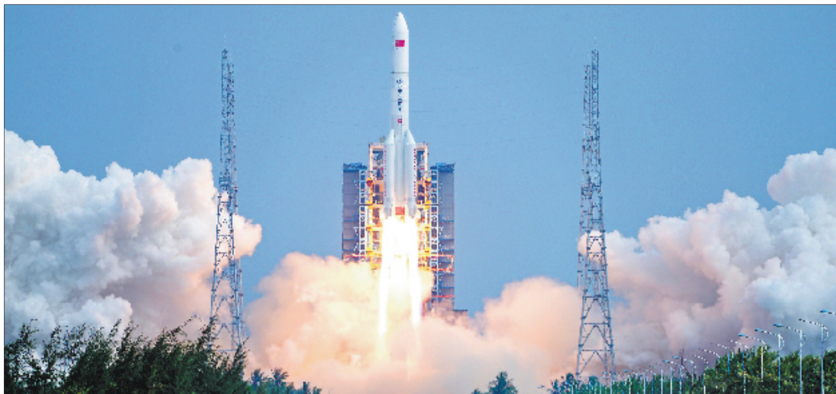
6月11日15时30分,我国在文昌航天发射场使用长征五号运载火箭,成功将通信技术试验卫星二十五号发射升空,卫星顺利进入预定轨道,发射任务取得圆满成功。

为抵消重力与引力等带来的损耗,研究者们制造了“升级版”的多级串联式火箭,我国的长征三号A、美国的土星5号(Saturn V)等都是典型代表。在飞行过程中,多级串联式火箭可以在