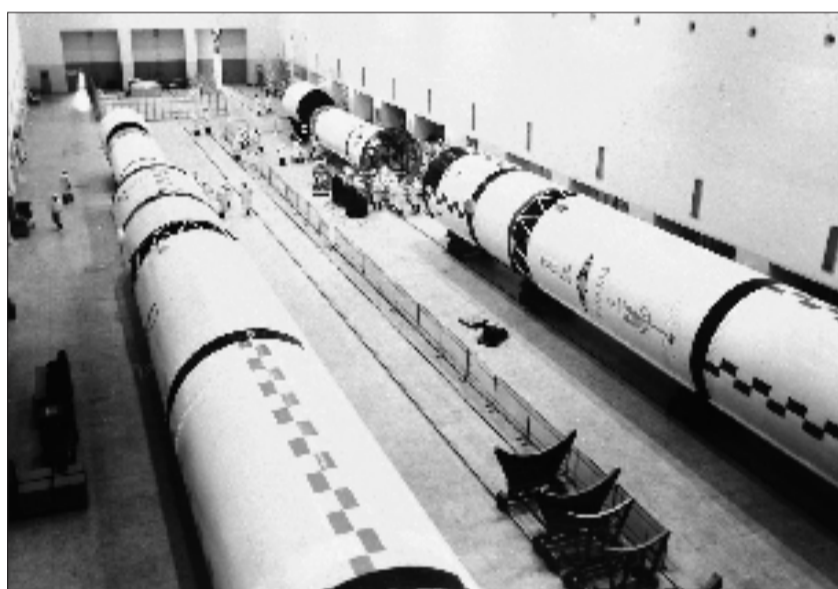
“长征三号”火箭在出厂前作最后的总体测试(摄于1986年)。