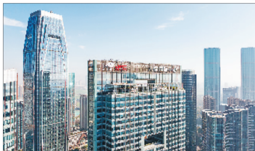
京东南江区域中心落地萧山区

5倍，人员减少20%，有效库存下降21%，客户满意率提升67%。更值得关注的是，友成机工不仅自己“改”出了成效，还孵化专注于为制造业企业提供数字化转型解决方案的高新技术企业友成科技，聚力研发工业数据中台和管理系统，让工厂里的数据自动采集、分析，从“被改造者”变成“改造者”。