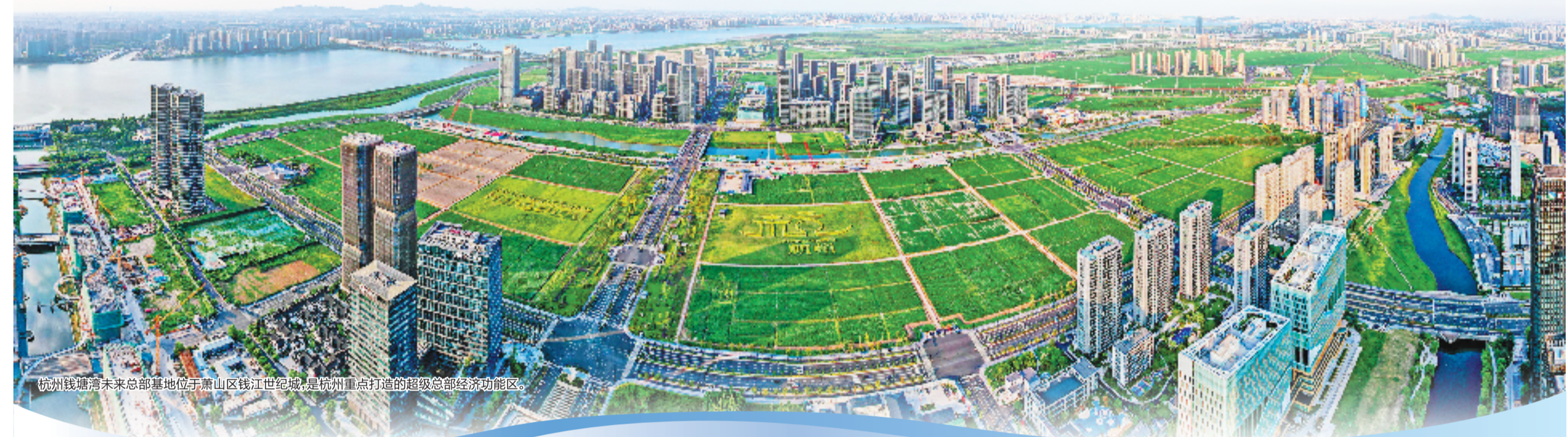
杭州钱塘湾未来总部基地位于萧山区钱江世纪城，是杭州重点打造的超级总部经济功能区。

萧山是观察浙江服务业高质量发展的一个鲜活样本——透过这扇“窗”，看到的正是浙江以“两业融合”作答产业发展时代之问的探索与实践。