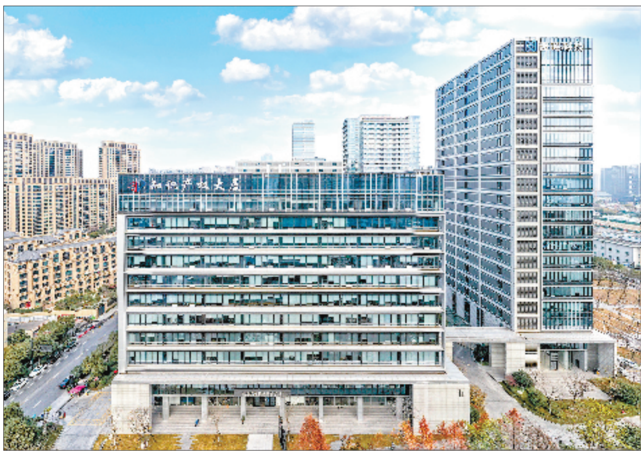
高新区(滨江)知识产权大厦