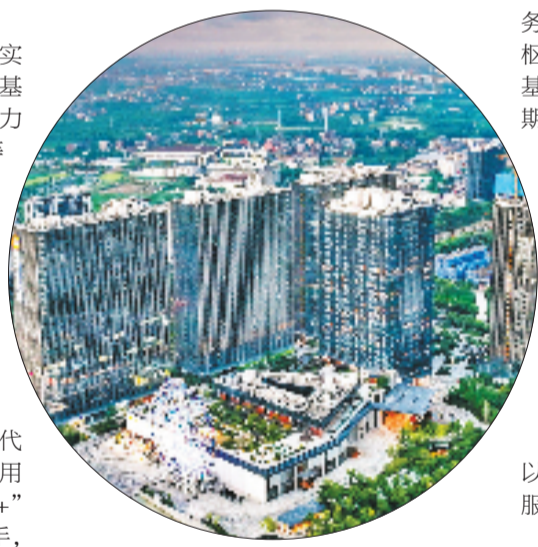
国家对外文化贸易基地(杭州)

正在打造杭州城市新中心的余杭，不仅有以阿里巴巴为代表的科技创新活力，还有以5000年良渚文化为代表的深厚文化底蕴。在这样的“文化+科技”土壤上，余杭生长出了郁郁葱葱的文化产业——