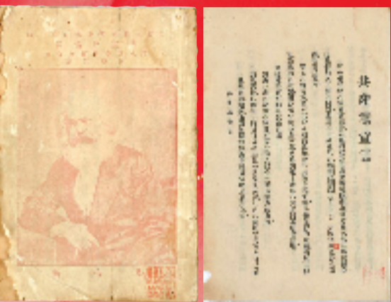
《共产党宣言》首个中文全译本。