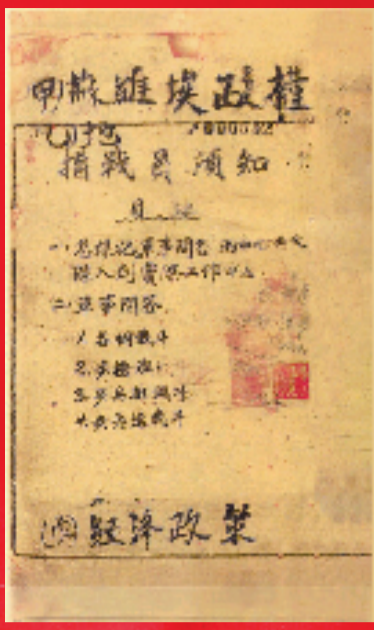
《闽浙赣苏区红军政治教材》。