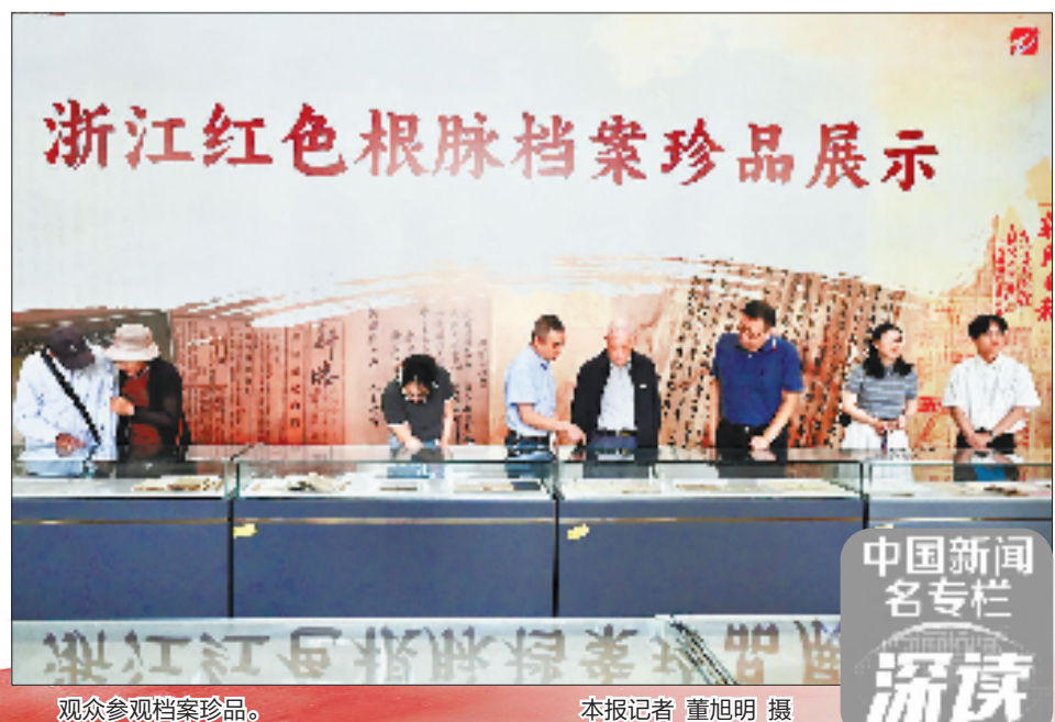
观众参观档案珍品。