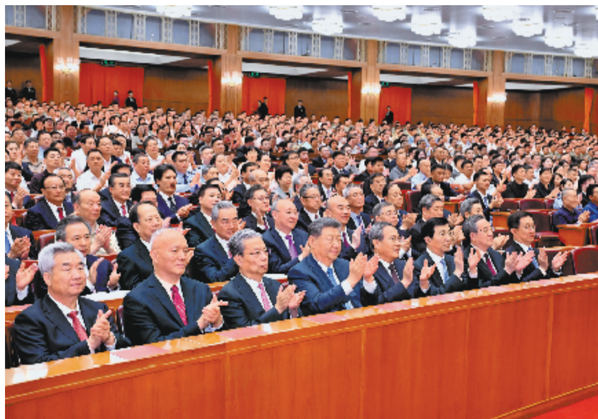
6月29日晚,庆祝中国共产党成立105周年音乐会《人民至上》在北京举行。习近平、李强、赵乐际、王沪宁、蔡奇、丁薛祥、李希、韩正等党和国家领导人,同约3000名观众一起观看演出。

新华社北京6月29日电 深情乐章致敬辉煌历程,嘹亮歌声唱响人民史诗。庆祝中国共产党成立105周年音乐会《人民至上》29日晚在京举行。习近平、李强、赵乐际、王沪宁、蔡奇、丁薛祥、李希、韩正等党和国家领导人,同约3000名观众一起观看演出,共同庆祝这个光荣的节日。