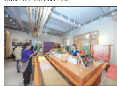
活动当天,江南染织院开业。