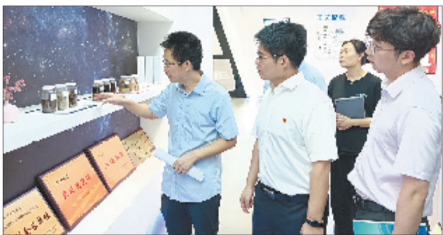
农行台州经济开发区支行到福星生态调研产品生产情况

走进台州黄岩云国植保合作社的育秧大棚，农行黄岩支行党员客户经理正调研大棚的运转情况。棚内智能温控系统安静运转，风机、传感器、加湿器等设备自动调控着棚内温湿度，这座“会呼吸”的大棚在农行金融活水浇灌下，将育秧效率提升约三成。