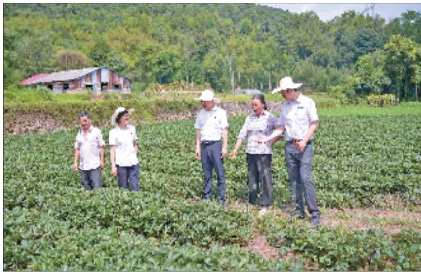
农行三门支行老党员带队走村入户考察农业种植情况

“瓜农贷”滋润了新疆的台州瓜农，“青蟹贷”激活了三门湾的滩涂，“杨梅贷”甜透了仙居的山岗。农行台州分行的金融活水正通过各类特色惠农信贷产品，精准浇灌着一条条“土特产”产业链，