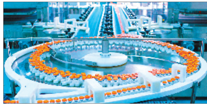
海正生物制剂生产线

创新驱动,更离不开人才的智力支撑。去年,椒江依托产业链精准引才,创新推行“企业认定、政府认账”“校企双聘”等机制,各类人才纷至沓来;新招引落地海外专家10人,新引育高层次人才超3000人,选聘选派“科技副总”“产业教授”24名,全年引进大学生超2万人。