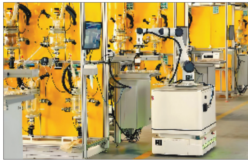
道致科技中试平台