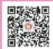
仁济学院微信公众号