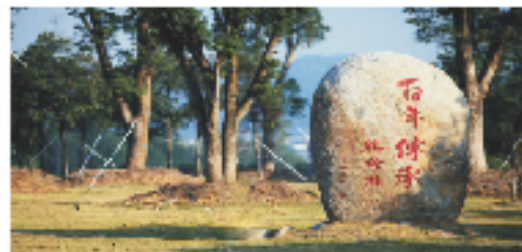
共享茶山校区、滨海校区、学院路校区。