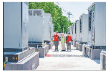
国网长兴县供电公司“碳效工程师”团队走进浙江世纪晨星纤维科技有限公司,对企业用能结构和节能降碳潜力开展专项走访。

小明说:“专业的服务能力是优质服务的基石。”该公司主动对接县人社局,组织28名一线员工参与碳排放核算员专项培训及取证工作,打造一支懂能源、懂碳效、懂企业的复合型电力服务队伍,为常态化开展碳效服务提供人才支撑。以数智管控激活降碳动能,以优质服务共创绿色价值。眼下,在长兴这片热土上,基于数据赋能的电力服务正不断激发绿色发展活力。国网长兴县供电公司依托省级首个县域碳排放管控中心,不断深化工业碳效价值共创场景建设,用电力数字化能力打通数据、监管、服务全链条,不断优化定制能源服务,为区域经济社会绿色转型提供坚实的电力支撑。国网长兴县供电公司“碳效工程师”团队走进浙江世纪晨星纤维科技有限公司,对企业用能结构和节能降碳潜力开展专项走访。