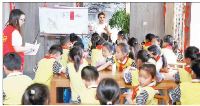
孩子们正在“四点半课堂”上课。

心理健康是项目的重要一环。“心灵有约”工作室由专业家庭教育咨询师团队参与,深入排查未成年人成长中的潜在问题。针对厌学儿童、单亲家庭子女等特殊群体,提供一对一心理咨询。目前已成功处理14起个案,帮助孩子化解心理困扰、重塑阳光心态。资源整合是项目可持续发展的关键。社区联动黄湾小学、敬老院、“五老”团队及7个周边村社,形成全方位资源联动体系。同时,项目主动辐射带动袁花镇花溪社区、尖山村、五丰村等7个村社,通过经验分享、实地观摩等