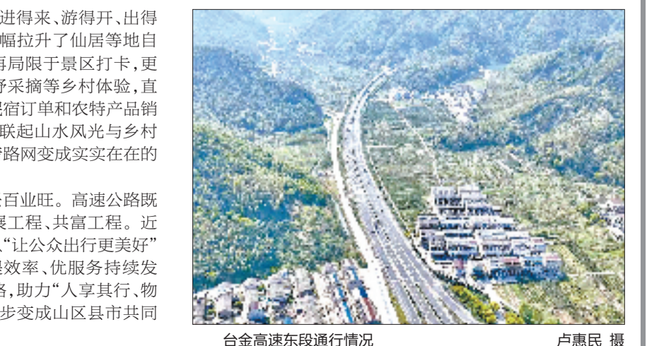
台金高速东段通行情况

路畅民心顺,路兴百业旺。高速公路既是民生工程,更是发展工程、共富工程。近年来,台州管理中心以“让公众出行更美好”为导向,从保畅通、提效率、优服务持续发力,用一条条高速公路,助力“人享其行、物畅其流”的愿望,一步步变成山区县市共同富裕的生动实景。