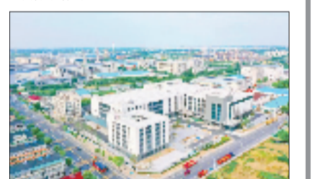
南浔区练市镇高新技术产业园

为高质量发展胜势,全区各部门、各镇街紧扣产业升级主线,推动传统优势产业焕发新生、新兴科创产业加速崛起,为区域经济高质量发展注入源源不断的新动能。