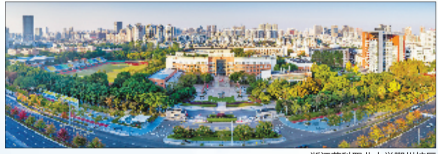
浙江药科职业大学鄞州校区