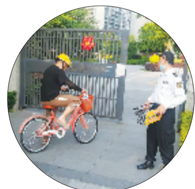
滨湖区小区针对“小哥共享单车”试骑情况做出优化提升

人次。今年以来，灵芝街道以“契约化共建”推动统战力量与基层党建融合，将统战资源有效融入新时代“枫桥经验”矛盾化解全链条，构建“社