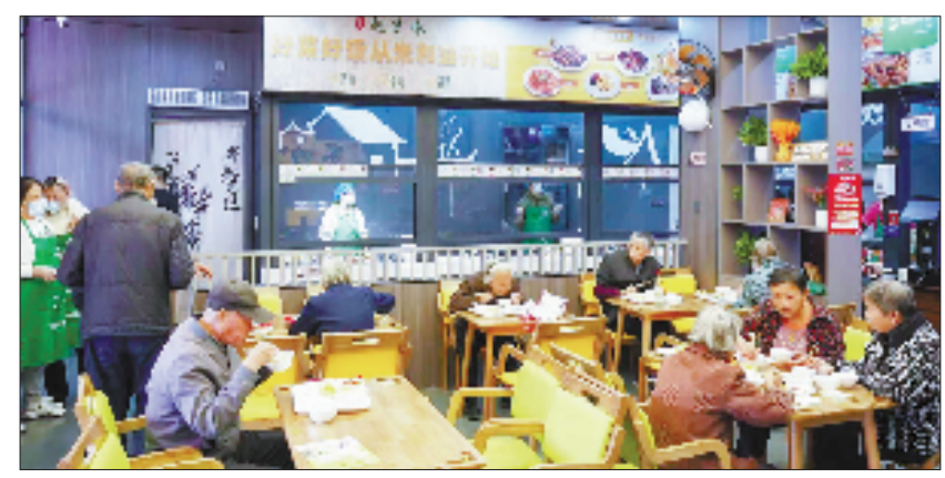
老人在后墅路爱心食堂用餐