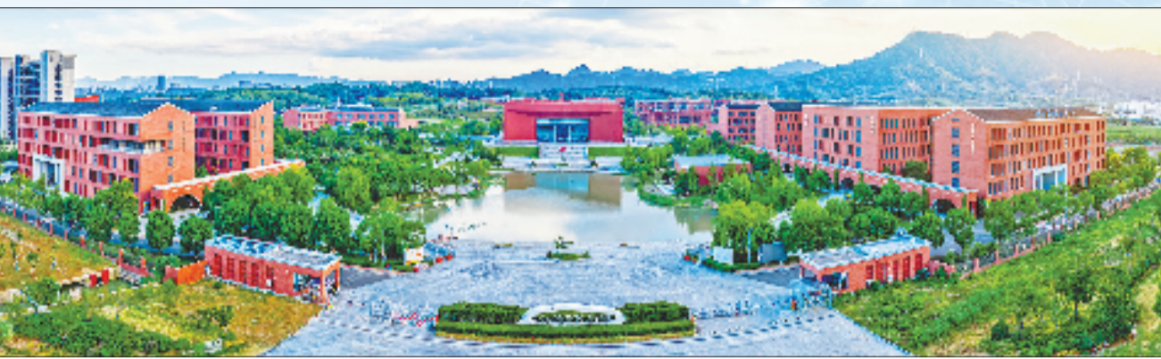
俯瞰浙江药科职业大学奉化校区

要阵地。毕业生去向落实率连续五年稳定在97%以上，2024年首届本科毕业生就业率位居全省本科院校前列。