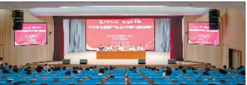
柯桥区南部三镇村社书记联训班

上下正统一思想、凝聚共识,奋力将中心镇建设的“规划图”转化为高质量发展的“实景图”,积极为柯桥区发展作出平水镇新的更大贡献。