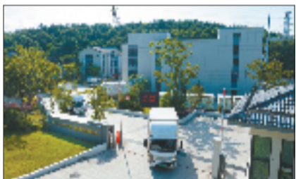
特废公司医废收运处置指挥中心项目

在宁波“全面绿色转型”的版图中,医疗废弃物收运是一道看不见却至关重要的防线。宁波环保集团旗下特废公司作为医疗废弃物收运单位,每天收运医废50吨,覆盖5200余家医疗机构和311