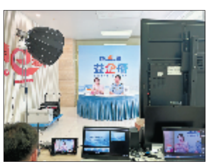
镇海区市场监管局探索“直播+个体户”服务

产销服务双赋能,铺就了富民“新路径”。在产销端,镇海区积极培育“共富工坊”示范典型,如九龙湖村民陈月波成立的“月波食韵坊”,吸纳10余名村民就业,传承传统糕点技艺,有效消化周边农户的滞销原料,让“老手艺”转变为富民新产业。同时探索“农户+村级基地”产业联结机制,全流程指导新建食品小作坊,以“小作坊”撬动土特产“大产业”。在服务端,紧扣基层治理能力提升,夯实食品安全网格化体系,通过上线6类涉食主体走访教学短视频、组织联合检查等方式强化队伍建设,网络累计上报二级及以上食品安全巡查事件8877件,以高效能治理切实提升群众幸福指数。