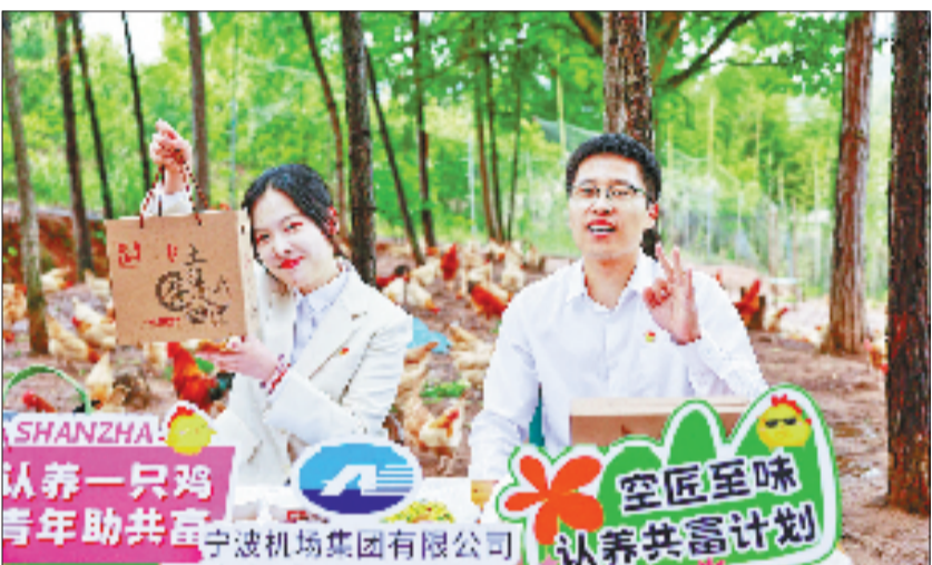
宁波机场驻村工作组正在直播带货

山海协作不是一阵风,而是一场长跑。宁波机场相关负责人介绍,将以国企担当持续扛起帮扶重任,让乡村百姓在文旅兴、乡村兴、百姓富的画卷中看到实实在在的共富成果。