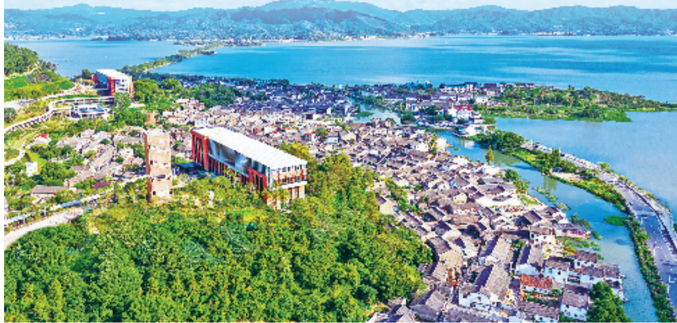
位于东钱湖畔的宁波院士中心