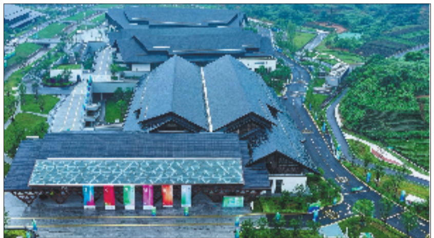
杭州茶叶博览会会议会展中心

馆，龙坞展馆的意义远不止于5天展期。西湖文旅集团相关负责人介绍，此次茶博会中，龙坞展馆打破了传统会展模式，将1.7万平方米的展示平台融入万亩茶园之中，让观众在茶香间沉浸式逛展。接下来，场馆将持续导入展会、研学、市集、赛事、论坛等多元场景，推动茶文化从展陈走向体验，让