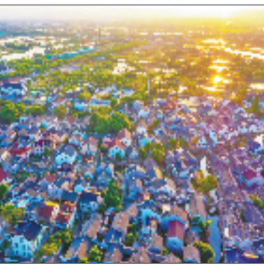
南浔获港片区航拍

5月17日—18日,杭州游客周丽娜与朋友在湖州南浔度过了一个悠闲的假期,白天在和孚镇四联村的云朵农场拍照打卡,傍晚到获港村的DiDi披萨店品尝窑烤披萨,晚上入住鱼桑民宿,枕水而眠。临走时她感慨:“一个周末、两个村子,玩得不重样,住得也舒服。”