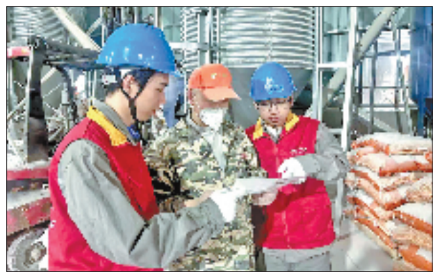
国网苍南县供电公司工作人员在温州喔喔农业有限公司开展专项用电安全检查。

一枚“喔喔”蛋,串联起企业、村集体、农户三方协同发展的共富纽带。下一步,国网苍南县供电公司将持续跟进金乡喔喔蛋鸡项目蛋品深加工、农旅体验等新业态延伸过程中的用电需求变化,动态优化供电服务颗粒度,以项目化运作支撑产业链升级,为苍南乡村振兴注入可持续、可感知、可复制的电力动能。